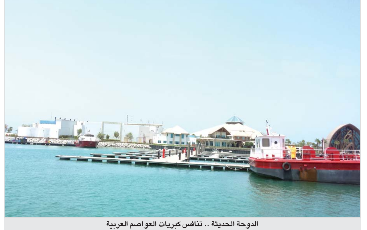
الدوحة الحديثة.. تنافس كبريات العواصم العربية