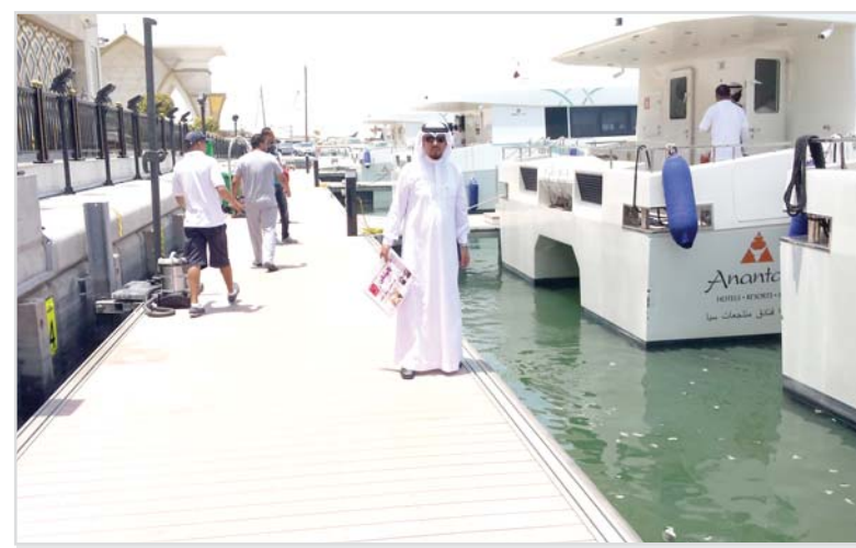
جولة بحرية (جزيرة البنانا)