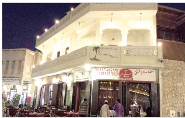
أول فندق في قطر.. فندق (بسم الله) أصبح علامة سياحية