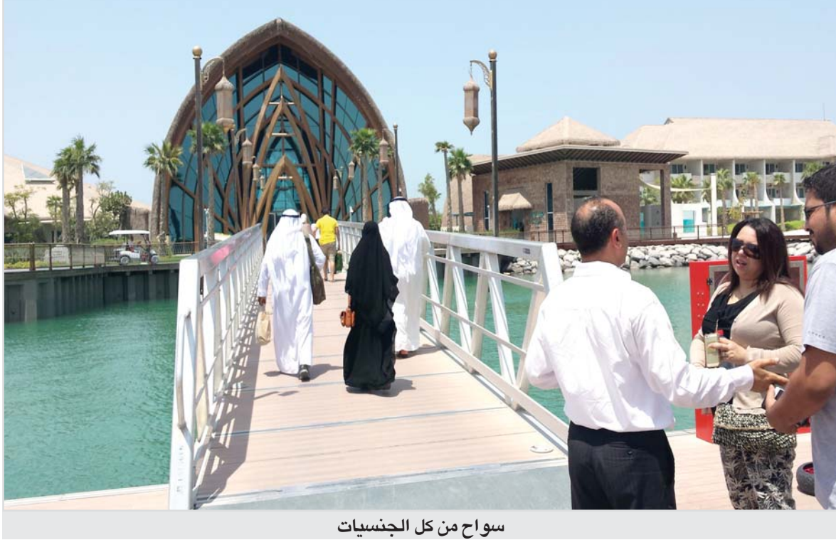
سواح من كل الجنسيات