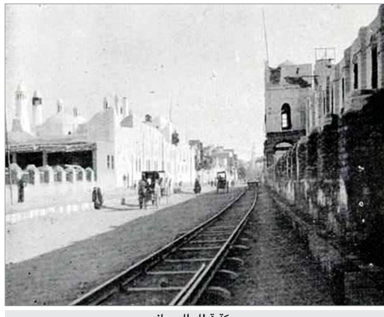
سكة قطار الحجاز