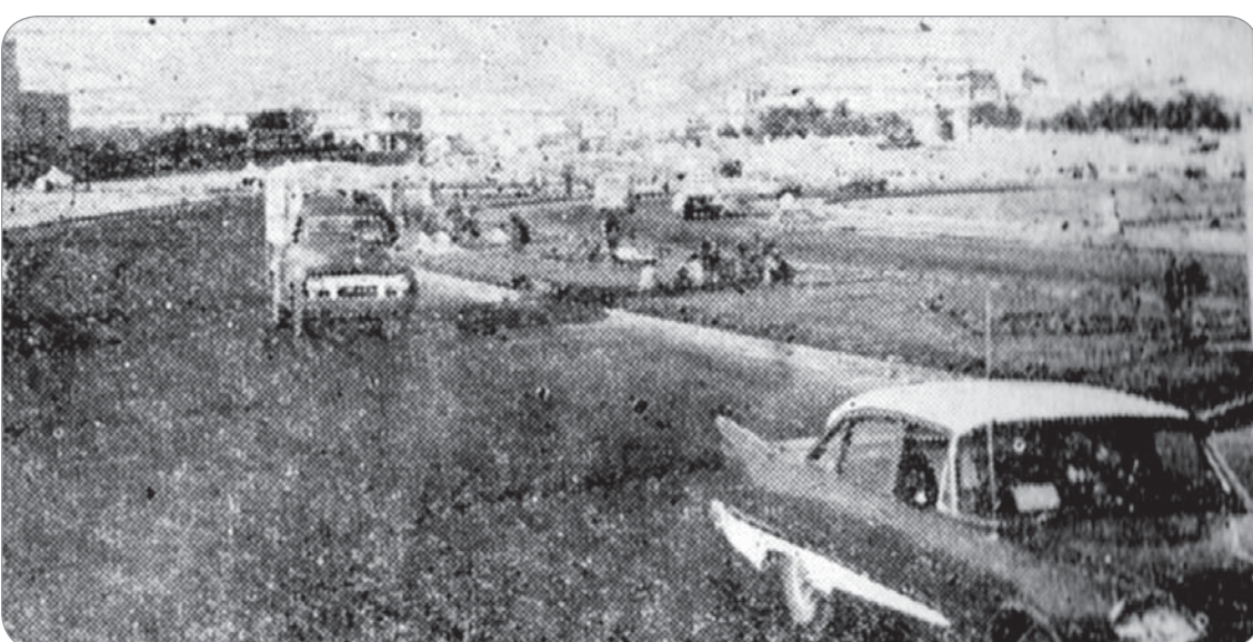
بدأت بلدية جدة في ائارة الميدان الجديد بعدما تمت سفلنته وغرس بعض الحشائش والاشجار الصغيرة فيه والصورة تمثل الميدان وهو في طريقه إلى ذلك.