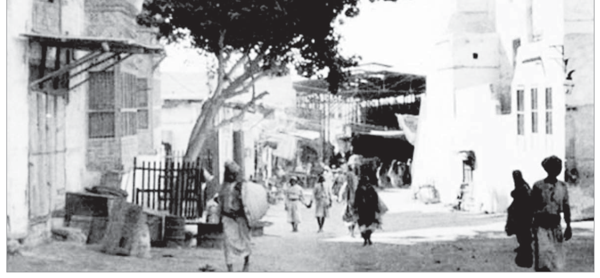
شارع في جدة ١٩٣٩ م