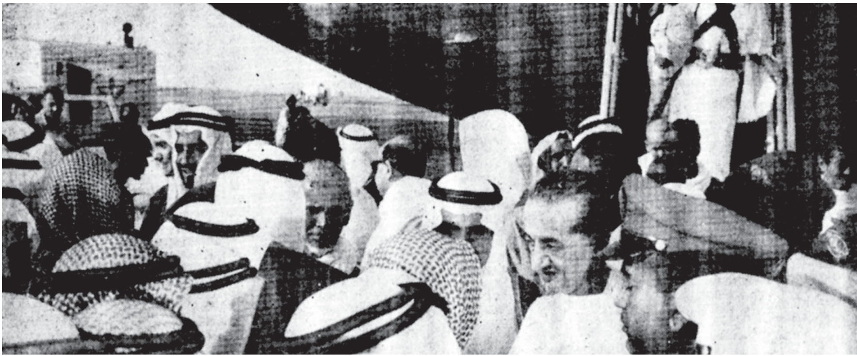
جلالة الملك فيصل يحيي مستقبليه لدى وصوله إلى مطار جدة أمس، وهو في ملابس الاحرام

الحرس بوصوله في تمام الساعة الثانية عشرة الاربعاً حتى تحولت شوارع العاصمة المقدسة إلى ضجيج من الهتاف كتحية للقائد ودعاء له في شهر الخير والبركات بأن يقبل الله منه عمرته وطوافه وكل اعماله للخير..