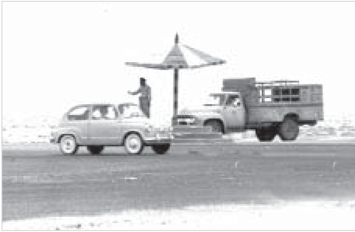
رجل مرور يقف تحت مظلته لتنظيم حركة المرو