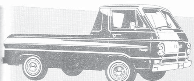
شاحنات فارتكو المتينة للحمولات الخفيفة