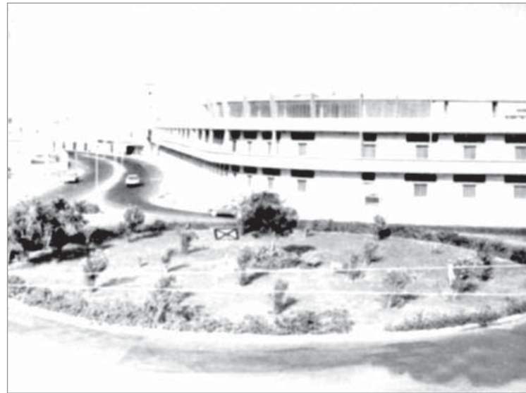
مدينة حجاج البحر - ١٩٦٣ م