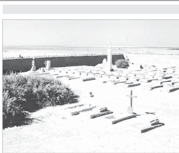
مقبرة غير المسلمين - جدة ١٩٤٧ م