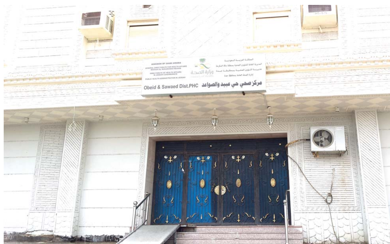
مركز صحي الصواعد