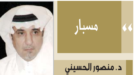
مسار د. منصور الحسيني

تحول حفل الزواج الجماعي لـ ١٥ شاباً من أبناء الغمامي إحدى قبائل الحويطات في الشمال الغربي إلى كرنفال جمع الثقافة المجتمعية من عروض تراثية والوان فلكلورية رائعة وقصائد شعرية حكت في مجملها قصة أمجاد هذا الوطن الغالي وصورت أهمية الوحدة والمواطنة والإلتفاف حول القيادة الحكيمه . كان ذلك في مركز أشواق جنوب مدينة تبوك. وقد اعتبر الحضور هذه الخطوة مثالا يحتذى به وقدوة حسنة لعوائل منطقة تبوك لإقامة حفلات الزواج الجماعية بهذا المستوى الرفيع المنظم الذي تعم فوائده الثقافية المسهمة في جوانب تربية النشء، وحث الشباب على الاهتمام بتراث الأبياء والأجداد وغرس روح المواطنة وحب الوطن في نفوسهم هذا خلاف تخفيف الأعباء المالية لتكاليف حفلات الزواج.