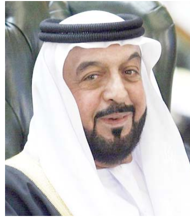
خليفة بن زايد

أسعار العملات التي تؤثر على المصدرين والوردين، إضافة إلى السياسات المالية المتبعة من قبل العديد من الدول حيث تعد كلها عوامل تؤثر في منح الاستثمار في صناعة الأسمت. دول طلبت الانضمام: • اليمن بعد انتهاء العملية العسكرية التي عرفت ب «اليمين» طلب الرئيس اليمني هادي انضمام اليمن إلى مجلس التعاون الخليجي ونحو قوت درع الجزيرة إلى اليمن لتخليصه من احتلال الحوثيين ومليشيات علي عبد الله صالح للعاصمة صنعاء.