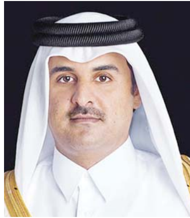
تميم بن حمد

أسعار العملات التي تؤثر على المصدرين والوردين، إضافة إلى السياسات المالية المتبعة من قبل العديد من الدول حيث تعد كلها عوامل تؤثر في منح الاستثمار في صناعة الأسمت. دول طلبت الانضمام: • اليمن بعد انتهاء العملية العسكرية التي عرفت ب «اليمين» طلب الرئيس اليمني هادي انضمام اليمن إلى مجلس التعاون الخليجي ونحو قوت درع الجزيرة إلى اليمن لتخليصه من احتلال الحوثيين ومليشيات علي عبد الله صالح للعاصمة صنعاء.