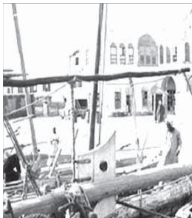
مدينة راس تنورة - الخمسينيات الميلادية

٤ - مستشفيات وه مستوصفات ١ - محجر صحي الحديثة ومحجرين صحيين ٢ مراكز كرتينية ٢ - محجر صحي بئر بن هرماس. قامت وزارة الصحة بالجواز عدد من كما باشرت الوزارة بتنفيذ المراكز المشاريع الضخمة.. وباشرت الوزارة الكرتينية وقد قارت على الانتهاء بتنفيذ اربعة مستشفيات منذ حوالي وهي: ثمانية أشهر وهي: ١ - مستشفى جيزان الجديد بما فيها يجري بهمة ونشاط في مستشفى خسون سريرا للعيادات الخارجية. الملك فيصل بالطائف ويتسع لثلاثين ٢ - مستشفى الطيف بما فيها خسون وخسين سريرا وينتظر استلامه سريرا للعيادات الخارجية. كما يجري العمل بمسشفى ٣ - مستشفى الرس بما فيها خمسة الشبه بمكة. ومن المنتظر استلامه وعشرون سريرا للعيادات الخارجية. في اوائل شهر ذي الحجة كما يجري ٤ - حيايات المدينة سعة خمسين العمل في توسعة مستشفى الولادة سريرا وكذلك ملحقات لسكن بالمدينة المنورة وسيتم استلامه قريباً. هذا وقد تم استلام مستشفى صفوه موظفي المستشفيات. اما المشروعات التي قامت الوزارة بتنفيذها وبعضها قد قارب على الانتهاء فهي: ١ - مستوصف خريص كما تم اصلاح ما تهدم من مستشفى ٢ - مستوصف البدائع أباها. وينتظر استلامه في الايام القليلة القادمة. ٣ - مستوصف سبت العلايا وقد بلغ مجموع ما اعتمد لهذه ٤ - مستوصف عروه. الاعمال في موازنة ٨٤ - ٨٥هـ هو ١٢٠٤٢٠٨٦ ريال. ٥ - مستوصف رنية. المحاجر الصحية قد باشرت الوزارة بتنفيذها ومنها ما قارب على الانتهاء وهو: