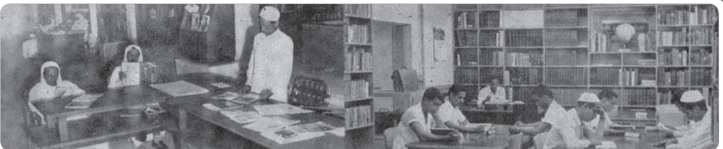
انتشار المكتبات العامة في مدننا الكبرى ساعد على تفتح الوعي بين مختلف طبقات المواطنين..

مكة - مكتب "البلاد" علم محجر "البلاد" بمكة أن بعضا من المواطنين بمحلة طلعة أم الخير بشعب عامر بمكة قد ابرقوا إلى حضرة صاحب السمو الملكي الأمير مشعل بن عبدالعزيز حول الاخطار التي تهددهم نتيجة ظهور مواسير المياه مكشوفة بجانب اسلاك الكهرباء فما كان من سمو الامير الا أن أكد من جديد تجاوبه المستمر مع مطالب المواطنين في البلد المقدس.