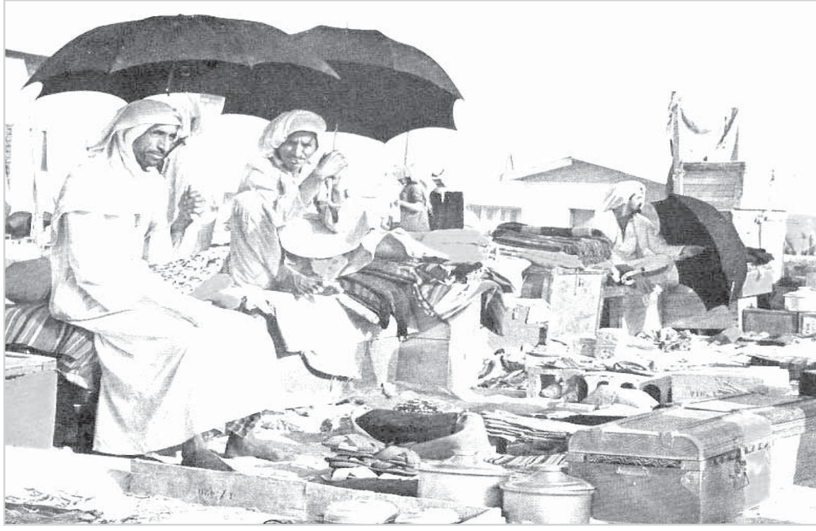
تجار يعرضون بضاعتهم