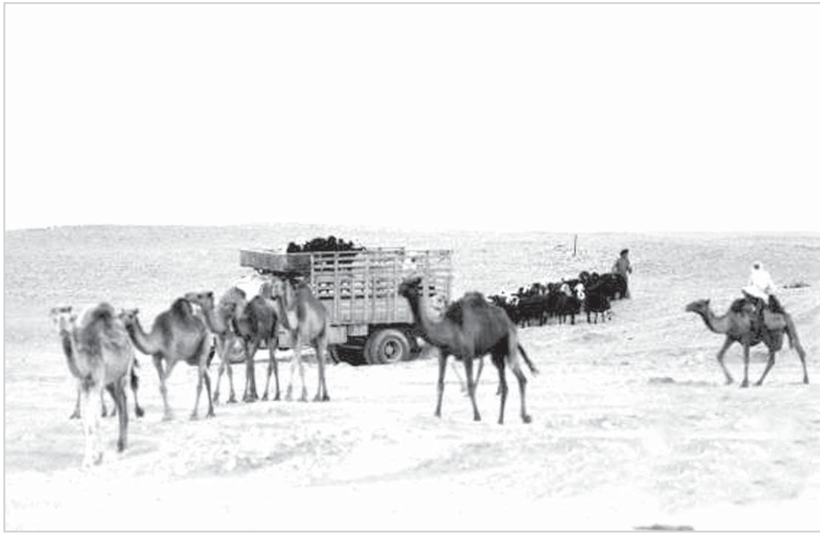
من البادية السعودية