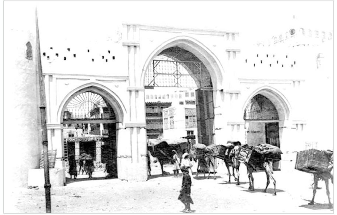
باب مكة، عام 1918م

هذه المواد نشرت بتاريخ 13-9-1384هـ - 1/15/1965م