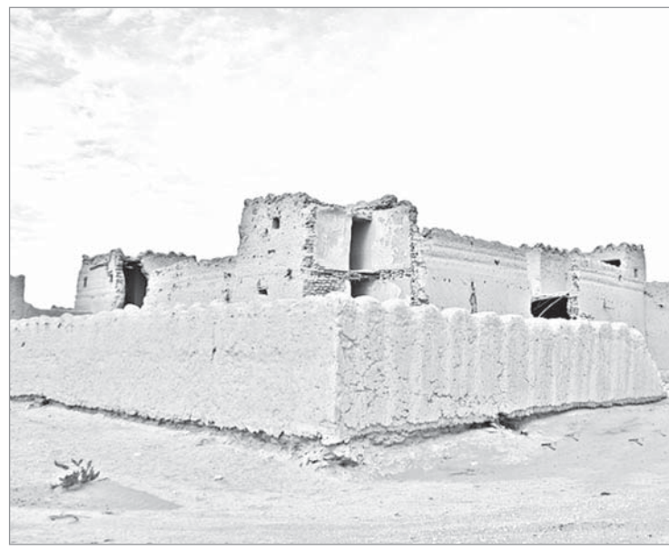
بيت قديم - الخرج