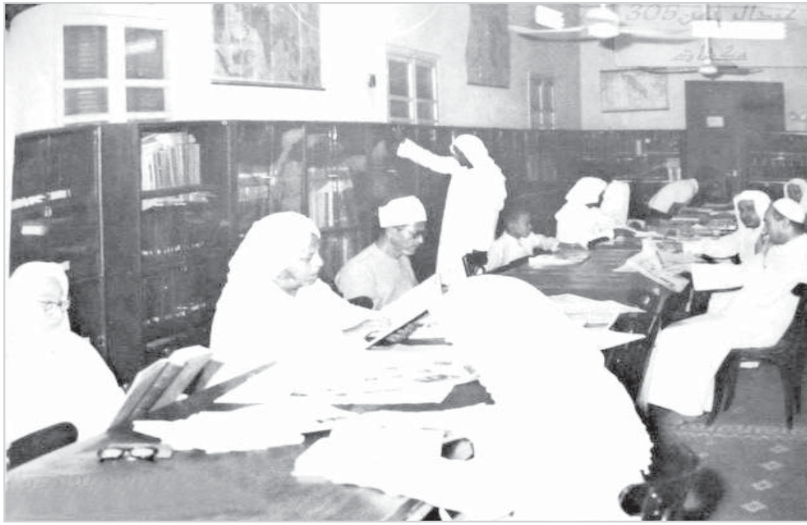
مكتبة الجامعة الإسلامية