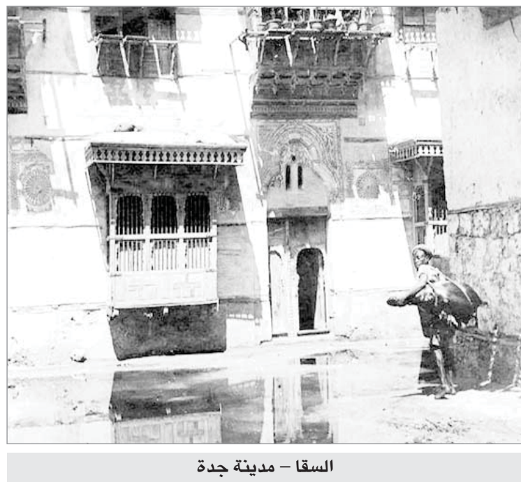
السقا - مدينة جدة