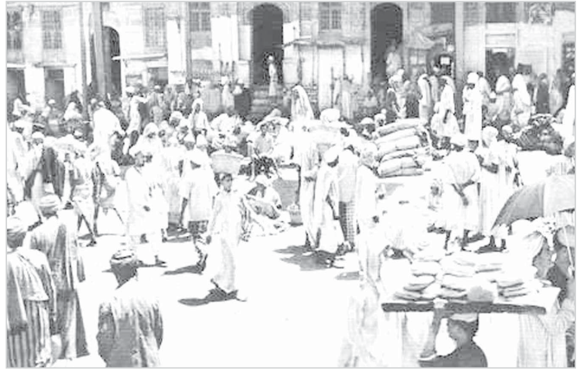
مكة المكرمة بجوار الحرم

هذه المواد نشرت بتاريخ 12-9-1384 هـ، 1/1/1965م