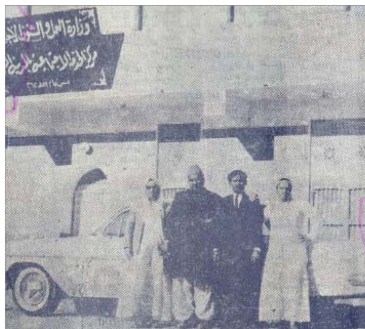
مركز الخدمة الاجتماعية بالمدينة المنورة