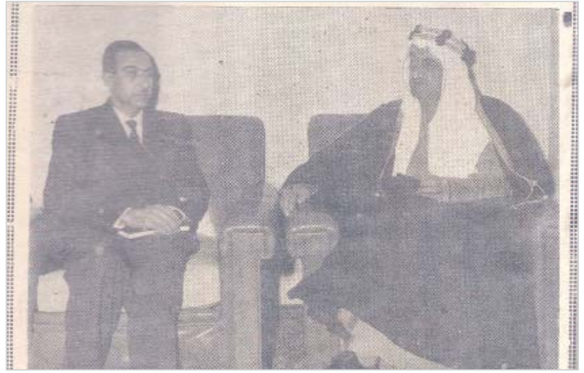
جلالة الملك فيصل يستقبل الصحافي الاردني الاستاذ عبدالحفيظ محمد

هذه المواد نشرت بتاريخ 22 - 9 - 1384 هـ - 1/ 21 / 1965م