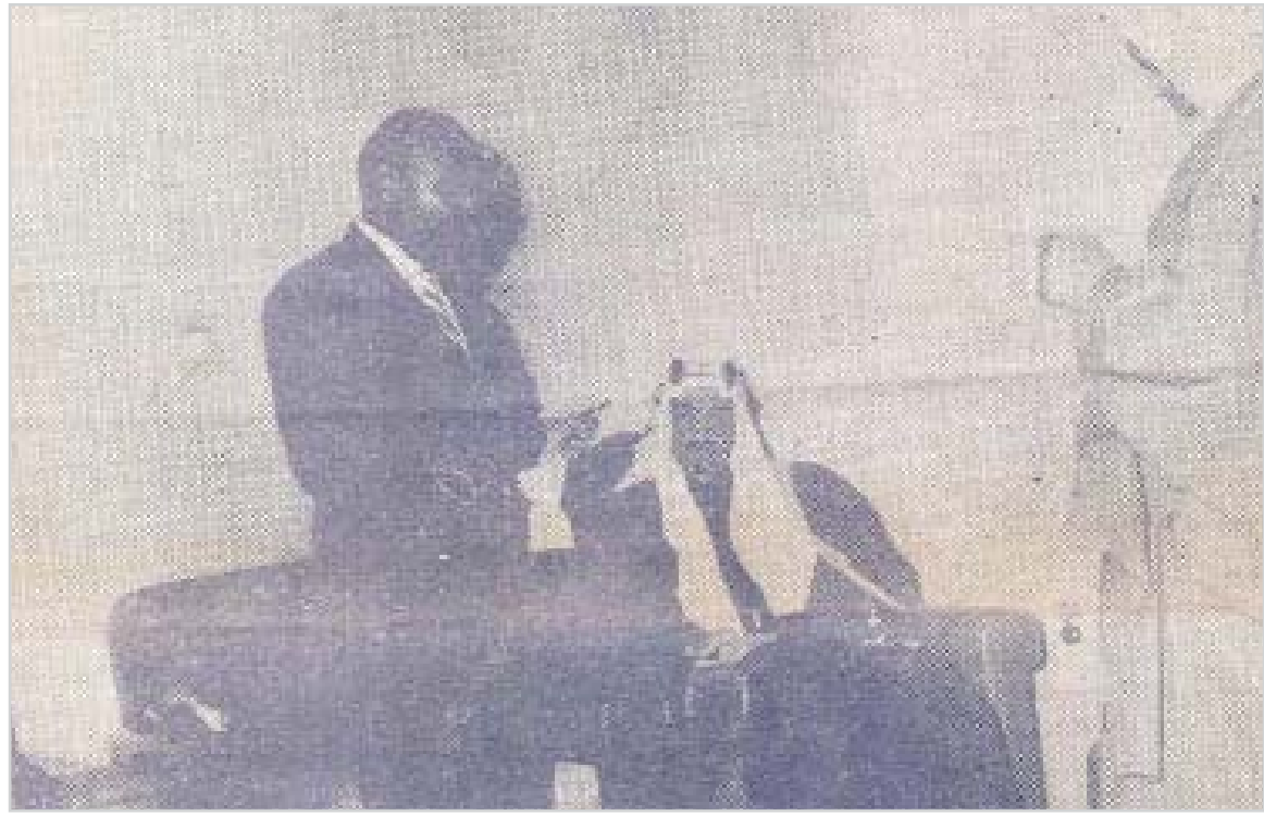
ويسقبل رئيس الوفد الاقتصادي الهندي