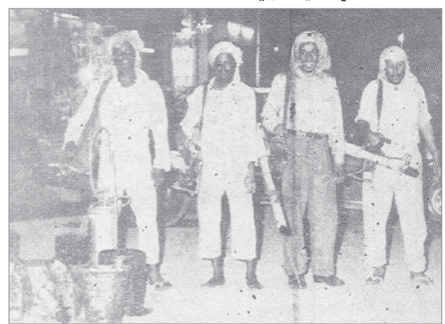
فريق التطهير والتنظيفات بأمانة العاصمة المقدسة