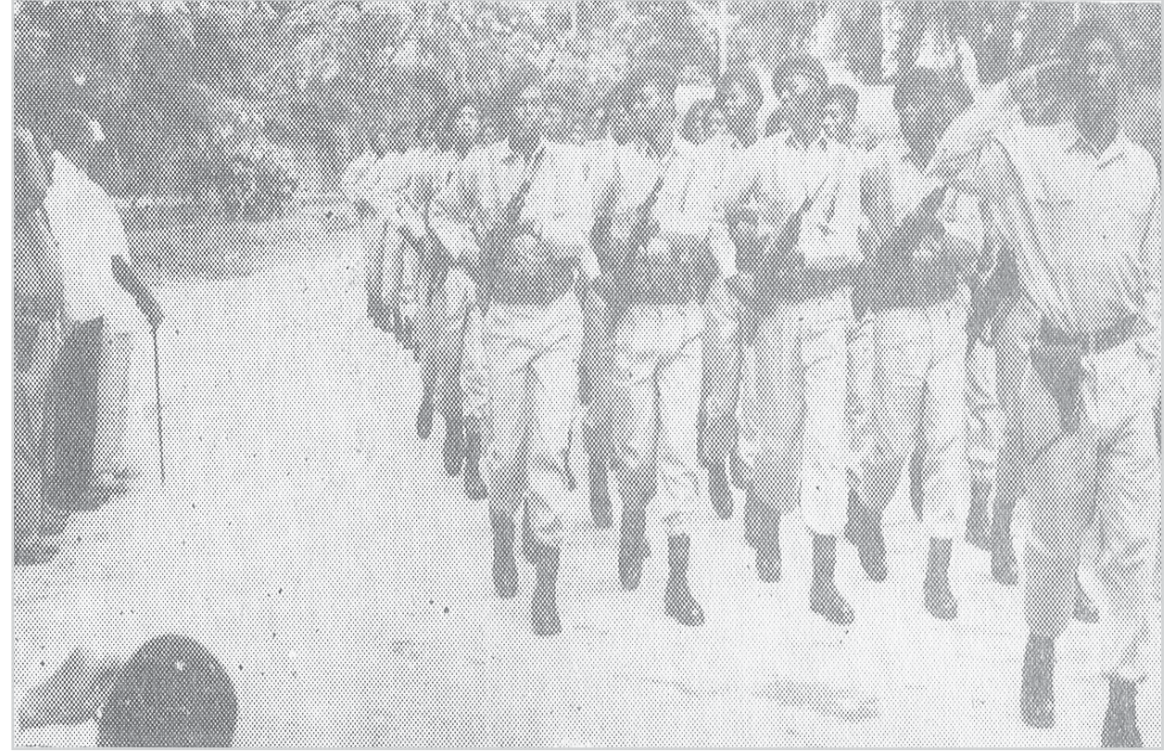
مشهد من استعراض الجيش السوداني بمناسبة الذكرى الأولى بيوم زنجبار الوطني