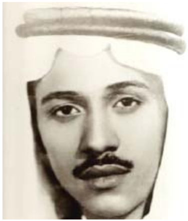
الأمير عبد الله بن سعود