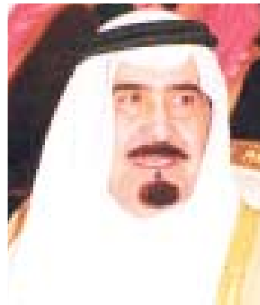
الأمير ماجد بن عبد العزيز