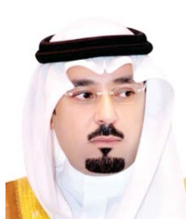
الأمير مشعل بن عبد الله

الملك السعود بن الملك الكامل صاحب مصر صارم الدين ياقوت عتيق الملك المسعود ضغنتكين التركي راجح بن قتادة أبو سعد الحسن بن علي بن قتادة جماز بن الحسن بن قتادة إدريس بن قتادة محمد أبو نمي الأول غانم بن إدريس بن قتادة حميضة بن محمد أبي نمي الأول رميثة بن محمد أبي نمي الأول عطيقة بن محمد بن أبي نمي الأول أبو العيث بن محمد بن أبي نمي الأول عجلان بن رميثة ثقيبة بن رميثة سند بن رميثة مغامس بن رميثة أحمد بن عجلان محمد بن أحمد بن عجلان عنان بن مغامس أحمد بن ثقيبة بن رميثة عقيل بن مبارك بن رميثة بن محمد أبي نمي الأول علي بن عجلان بن رميثة بن محمد بن أبي نمي الأول محمد بن عجلان بن رميثة الحسن بن عجلان بن رميثة بركات بن الحسن بن عجلان بن رميثة أحمد بن بركات بن الحسن رميثة بن محمد بن عجلان بن رميثة علي بن عنان بن مغامس بن رميثة أبو القاسم بن الحسن بن عجلان بركات بن محمد بن بركات بن الحسن بن عجلان هزاع بن محمد بن بركات بن الحسن بن عجلان أحمد الجيزاني بن محمد بن بركات بن الحسن بن عجلان حميضة بن محمد بن بركات بن الحسن بن عجلان محمد أبو نمي الثاني بن بركات بن محمد بن بركات بن الحسن حسن بن أبي نمي الثاني مسعود بن الحسن بن محمد أبو نمي الثاني عبد المطلب بن الحسن بن محمد أبو نمي الثاني أبو طالب بن الحسن بن محمد أبو نمي الثاني علي بن رسول