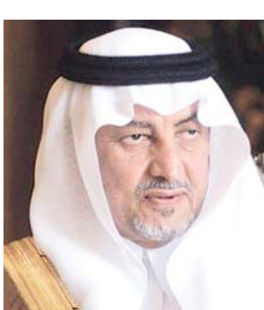
الأمير مشعل بن عبد الله