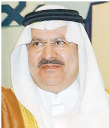
الأمير عبد المجيد بن عبد العزيز