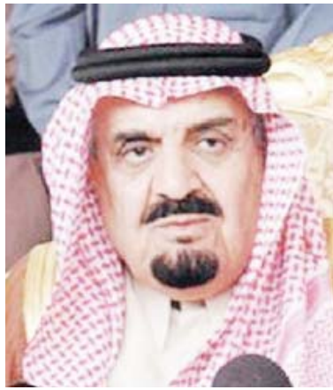
الأمير مشعل بن عبد العزيز