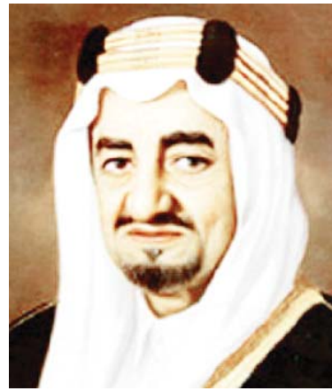
الأمير فيصل بن عبد العزيز