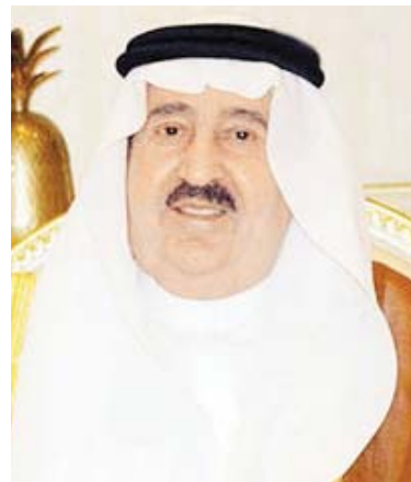
الأمير فواز بن عبد العزيز