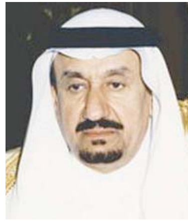
الأمير متعب بن عبد العزيز