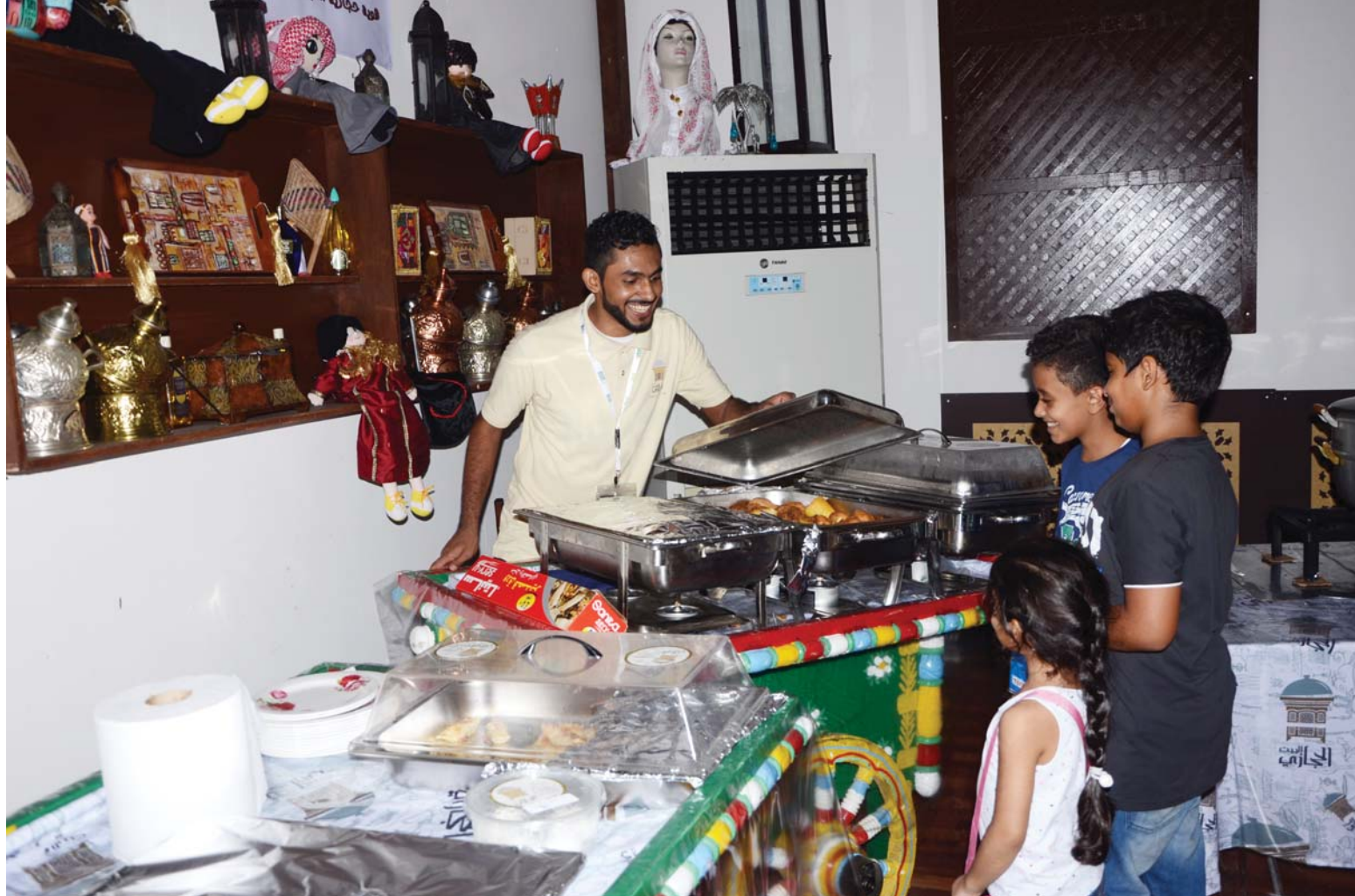
كتب - شاكر عبدالعزيز

عشقي وحبي لجدة التاريخية لا تحده أية حدود فانا واحد من الذين يعيشون الأماكن التاريخية سواء في المملكة او في مصر كانت جولتي هذه المرة في داخل احياء جدة التاريخية في ليلة رمضان التي باكملها تحول الى قطعة من الضياء بسبب الانوار والكشافات الهائلة التي تسيطر على المكان بدءاً من ميدان البيعة وحتى داخل احياء جدة القديمة باكملها وحتى (بيت نصيف).