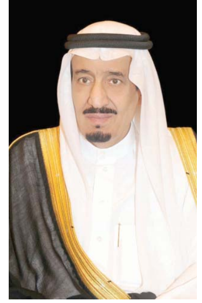
جدة - واس

بعث خادم الحرمين الشريفين الملك سلمان بن عبدالعزيز آل سعود برقية عزاء ومواساة لفخامة الرئيس رجب طيب أردوغان رئيس الجمهورية التركية في وفاة فخامة الرئيس سليمان ديميريل رئيس الجمهورية التركية الأسبق -رحمه الله- . وقال خادم الحرمين الشريفين // إننا إذ نبعث لفخاتكم ولأسرة الفقيد بالغ التعازي ، وصانق المواساة ، لنسال الله سبحانه وتعالى أن يتعده بواسع رحمته ومعفرته ، ويسكنه فسيح جناته ، وأن يحفظكم من كل سوء " إننا لله وإنا إليه راجعون //