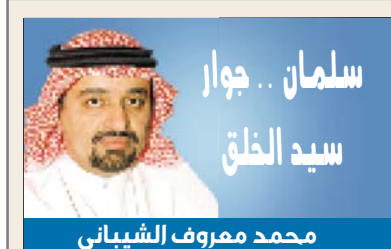
سلمان .. جوار سيد الخلق محمد معروف الشيباني

تفتح المدينة ذراعيها، كما فتحت دوما قلبها ووجدانها، للملك المفدى سلمان . وهي عنده بؤبؤ عينه الثانية التي تحتل الأولى منها مكة المكرمة. يزورها وقد أشغلت سكانها على مدى عامين داهية توسعة مفرطة لما حول المسجد النبوي، البالغ مخطوفاً فأضروا و انتزعوا سيف التوسعة ما لا حق لهم فيه ولا حاجة للمسجد به. كانت المساحات المزروعة فاشحة الإضرار بالسكان وفوق احتياجات التوسعة ولا تلبى إلا أنهم منتفعي الاستثمار الواضحين مصالحهم فوق اعتبار المكان ومظالم الناس وجوار سيد الخلق. يكفي أن يسأل صاحب القرار جهات التوسعة سؤلين : أين الدراسات الاجتماعية والديمقراطية لتأثير توسعتكم؟. و أين مخطوكم لمساحات العقارات المزروعة بعد نزعها؟. سيقابها بإجابة واحدة «لا توجد. طال عمر»، حتى الآن. فلا عرو أن تستصرخ المدينة خادم الحرمين الشريفين . ولا عرو أن يجيبها بما هو أمهه من إحصاف يوقف هدرها كان يجدر استبداله ببناء دور ثان فوق الحرم الحالي. هذا بافتراض مصداقية الحاجة للتوسعة التي هي محل نظر واختلاف من الأساس.