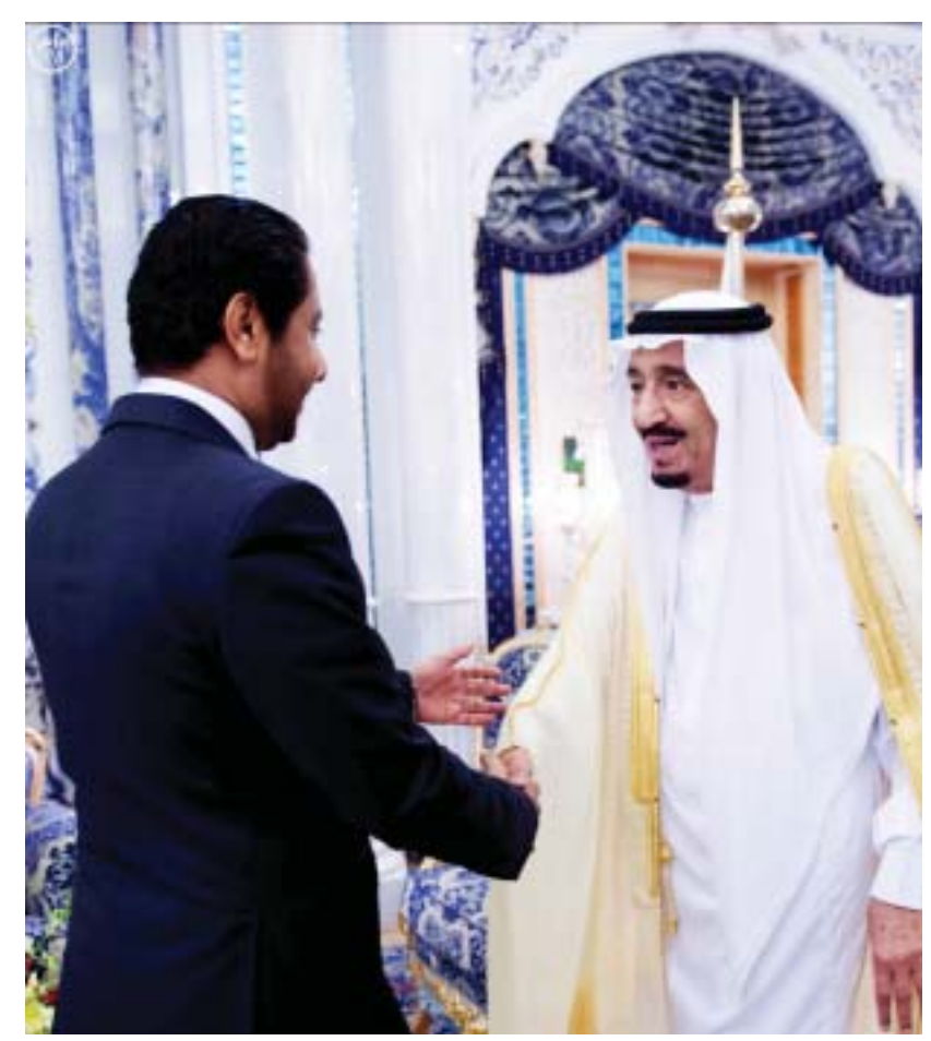
خادم الحرمين يستقبل عميد السلك الدبلوماسي ورؤساء المجموعات الدبلوماسية المعتمدين لدى المملكة .. ص ٣