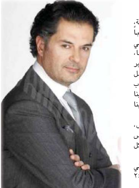
دبي - البلاد