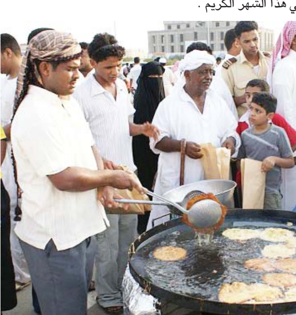
دبي - البلاد