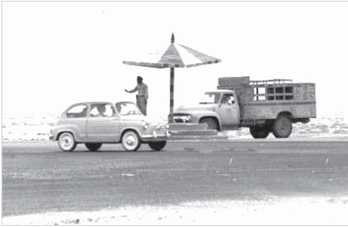
رجل مرور يقف تحت مظلته لتنظيم حركة المرور