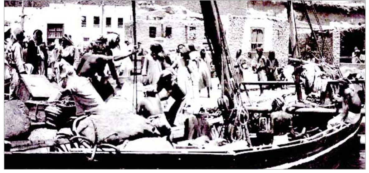
ميناء الوجه ١٣٣٦ هـ