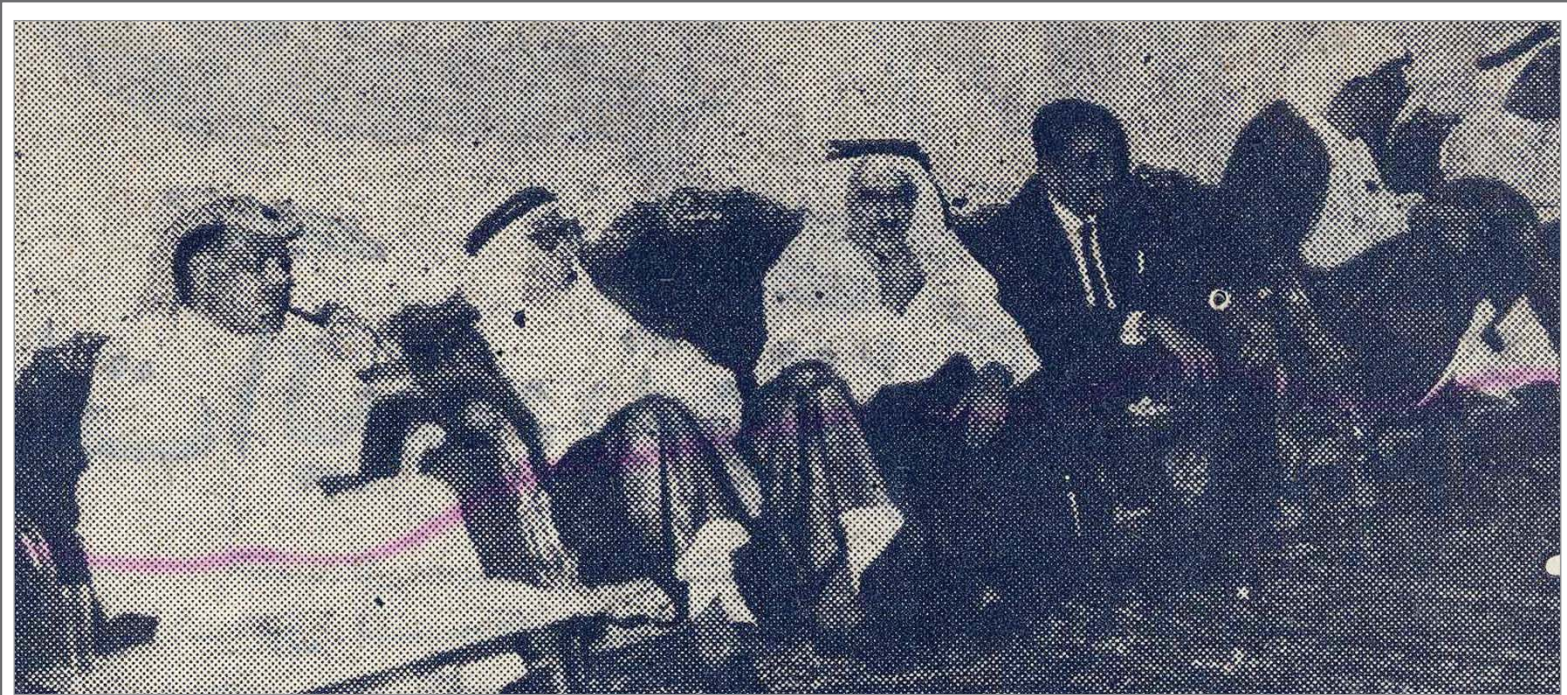
صورة للحفل يظهر فيها معالي الشيخ محمد عبد الله علي رضا وإلى جواره صاحب السعادة خير الدين الزركلي وعبد الرحمن البسام