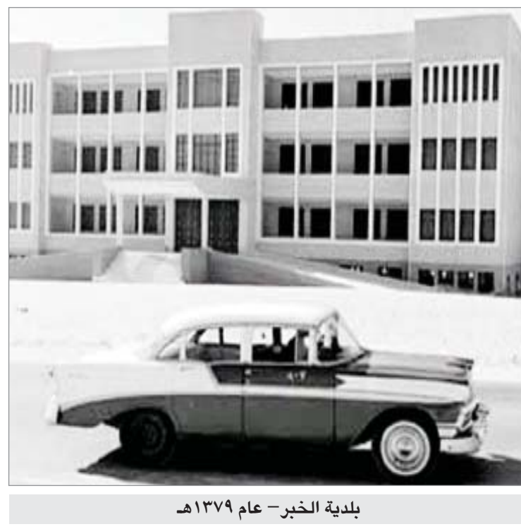
بلدية الخبر - عام 1379 هـ