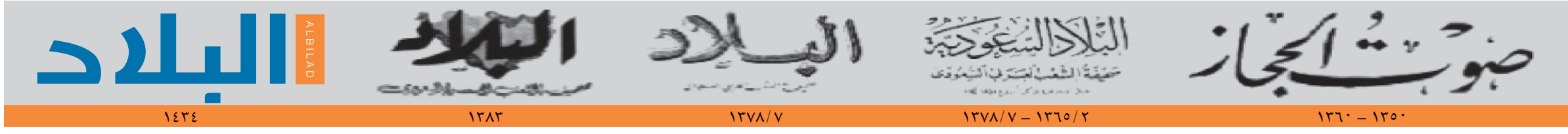
صور من التاريخ