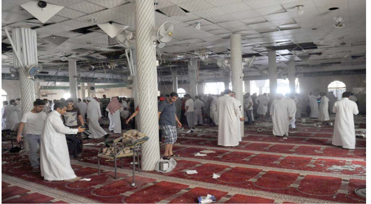
جدة - البلاد عبرت العديد من دول العالم ومجلس الأمن الدولي والدول العربية والخليجية وكافة الأوساط المحلية عن إدانتها البالغة للحادث الإجرامي الذي وقع في احد مساجد بلدة القطيع بالقطيع وطالبوا بالضرب بشدة على الايدي الأثمة التي قامت بهذا التفجير الإجرامي.