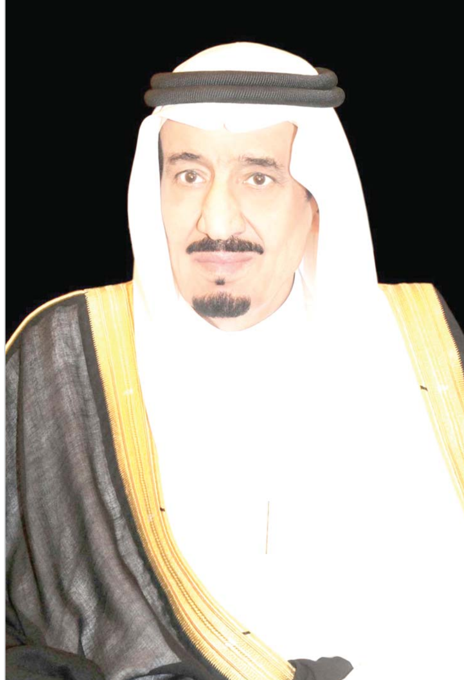
مكة المكرمة - لهند الإجمدي

يشرف خادم الحرمين الشريفين الملك سلمان بن عبدالعزيز آل سعود، بحفله الله، مساء غد الأحد الحفل الترحيبي الكبير الذي يقمه له أهله أهالي مكة المكرمة باشرف ومنايعة من صاحب السمو الملكي الأمير خالد الفيصل بن عبدالعزيز مستشار خادم الحرمين الشريفين أمير منطقة مكة المكرمة حيث تم الانتهاء من وضع كافة الترتيبات اللازمة لإقامة الحفل ابتداء من إقامة سراق الاحتفال بموقف حجز السيارات بطريق مكة جدة السريع ويضم الحفل على صور حية للحياة المكية قديما من أسواق تجارية ومحلات للبيع وماكولات شعبية ومقار عمد الأحياء ومراكز الأحياء والأعيان ونماذج للأحياء المكية القديمة مثل السوق الصغير والقشاشية وسوق الليل والمدعي والشامية والقرارة بالإضافة إلى صور حية للزواج المكية ورفة العريس وغير ذلك من الصور والمجسمات التي تجسد الحياة المكية القديمة. وقد انتهت جميع الاستعدادات لاعاداة المقر الرئيسي للحفل وحفلاته لإخراجه بصورة مشرفة ومناسبة تليق بمكانة الحفلي به ومكانة مكة المكرمة في قلوب زوارها وعابرها.