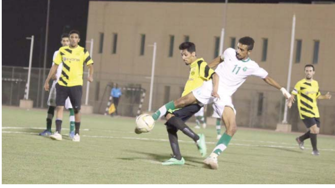
"محبوب سعد في المباراة دون ورود اسمه وقررت الرابطة شطب حارس الفهد على وتوجيه إنذارات لإداري الفرق المخالفة واحالت الدوسرى ومعاذ الريمي من كشوفات البطولة بقية الملفات للجنة الانضباط في الرابطة.

ووقع فريق لاروخا في خطأ إداري أمام المعذر تمثل في إشراك اللاعب رقم ٢