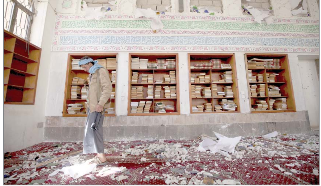
جدة - البلاد منازلت كافة الأوساط المحلية في بلدة القديع بالقطفيف تؤكد وقوفها خلف القيادة الرشيدة صفًا واحدًا ضد من يحاولون زرع بذور الفتنة والفرقة بين أبناء الشعب الواحد.