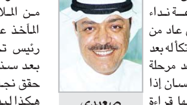
الزميل مدير اذاعة نداء الاسلام السابق الذي عاد من القاهرة التي اتخذها مكاناً بعد تقاعده قال ان التقاعد مرحلة جديدة من حياة الانسان اذا ما استطاع ان يستغلها قراءة واطلاعا فهي ليست كما يطلق عليها البعض - مت... قاعد - بل هي حياة متواصلة ويمكن ان تطلق عليها (عش واقفا).