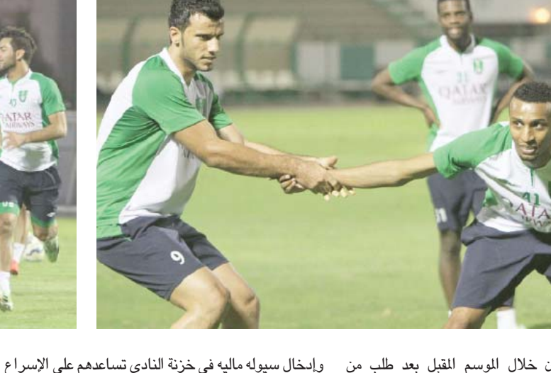
الحاجة الفنية للاعبين خلال الموسم المقبل بعد طلب من السويسري كريستيان جروس بالتعاقد مع لاعبين محترفين قبل معسكر الفريق المقبل في سيويسرا مع طلبه استمرار ويسعى الأهلاويين لتصريف البرازيلين من أجل الاستفادة