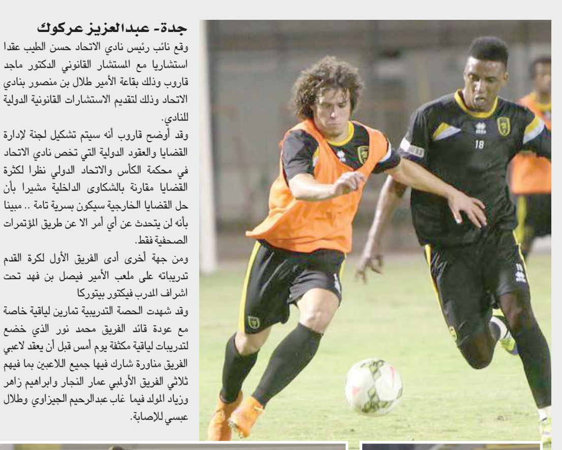
وقد أوضح قاروب أنه سيتم تشكيل لجنة لإدارة القضايا والعقود الدولية التي تخص نادي الاتحاد في محكمة الكأس والاتحاد الدولي نظرا لكثرة القضايا مقارنة بالشكاوى الدلخلية مشيرا بأن حل القضايا الخارجية سيكون بسرية تامة .. مبينا بأنه لن يتحدث عن أي أمر الا عن طريق المؤتمرات ومن جهة أخرى أدى الفريق الأول لكرة القدم تدريباته على ملعب الأمير فيصل بن فهد تحت اشراف المدرب فيكتور بيتوركا