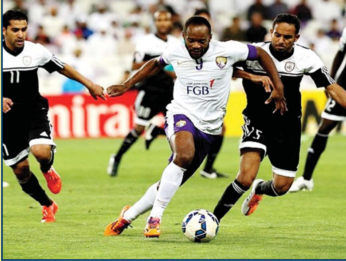
باختاكور × الشباب

في المجموعة الثانية يحل فريق الشباب ضيفاً على باختاكور الأوزبكي وذلك عند الساعة ٦:٣٠ و سيدخل الشباب لقاءه لتأدية الواجب أمام باختاكور الأوزبكي بعد أن فقد آمال التأهل إلى الدور القادم حيث كان حصاد مجموع مبارياته الخمس نقطتين وضعته في ذيل الترتيب من مجموعته ، في المقابل يختلف الطموح عند المستضيف باختاكور الأوزبكي فهو يدخل لمواجهة وفي رصيده ٦ نقاط و يسعى لتحقيق الفوز إلا أن عينه ستكون على لقاء العين الإماراتي و نقط طهران حيث يتمنى أن يحقق العين الفوز ليضمن باختاكور بطاقة التأهل ، وسيلعب الشباب دوراً مهماً في تحديد هوية المتأهلين عن المجموعة إذ سيرفع باختاكور رصيده لتسع نقاط منتظراً نتيجة العين مع نقط طهران . وفي ذات المجموعة يدخل فريق العين الإماراتي مواجهته الحاسمة حينما يستضيف فريق نقط طهران الإيراني ويدخل العين الإماراتي وفي رصيده ٩ نقاط حيث أن الفوز أو التعادل ستأهل متصدراً المجموعة في المقابل يدخل نقط طهران لمواجهة وعينه على الثلاث نقاط التي تضعه متصدراً ولا يريد أن يضع نفسه في حسابات معقدة حيث أن الفوز يؤهله بالمركز الأول .