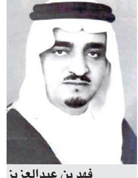
فهد بن عبدالعزيز