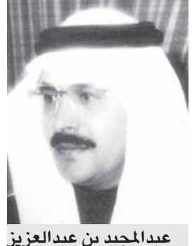
عبدالمجيد بن عبدالعزيز