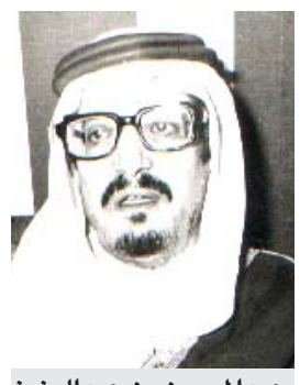
عبدالحسن بن عبدالعزيز

هنأ الرئيس كنيدي الاتحاد السوفيتي بنجاح اطلاق رجل الفضاء السوفيتي الثاني.