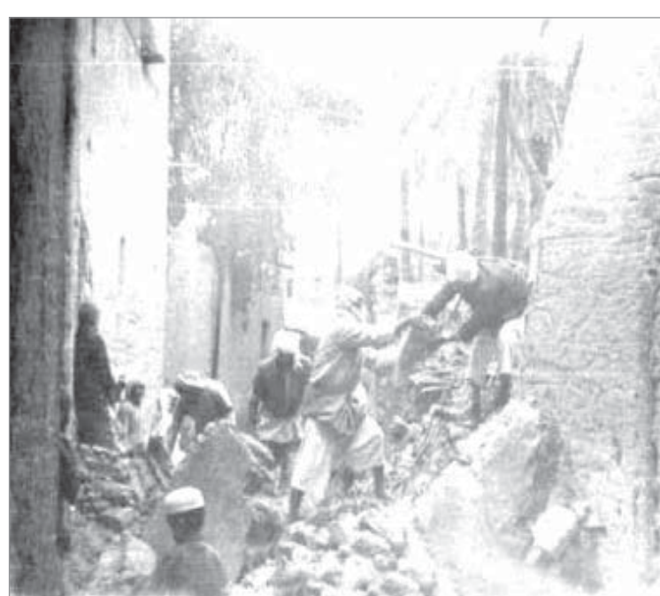
صورة من صور التكتاف الاجتماعي - عنيزة

الرياض: منذ ان وصل معالي وزير الزراعة الشيخ حسن المشاري الى الرياض وهو يواصل اجتماعاته بكبار المسؤولين في الوزارة وقد اجتمع بسعادة وكيل الوزارة لشؤون المياه ومدير عام الوزارة وتباحث معهم في كثير من شؤون الوزارة ومشاريعها.