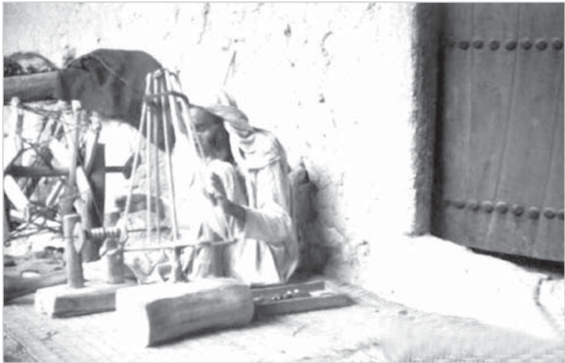
رجل يجهز معداته لحياكة النسيج اواسط الاربعينات - الهفوف