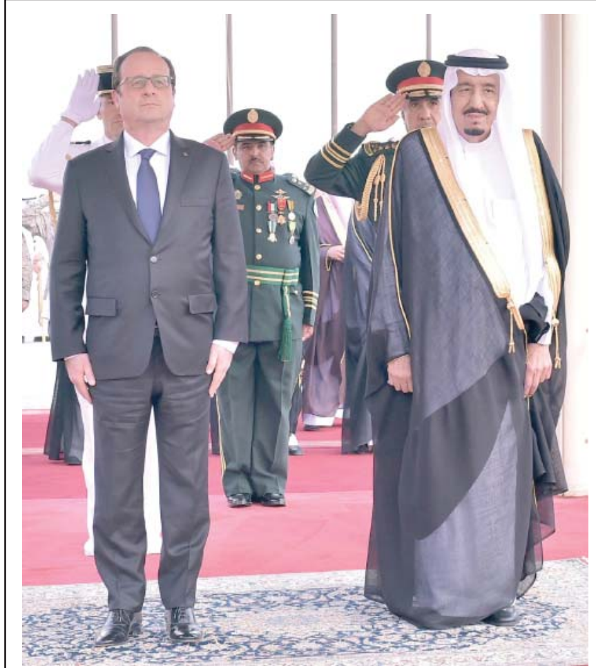
خادم الحرمين يبحث مع هولاند تطورات الأحداث .. ص ٢

مجلس الوزراء يستعرض الأوضاع الراهنة ويؤكد: