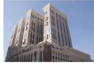
واجهة فندق حياة أحد المشروعات الجديدة بمنطقة جبل عمر التي سيتم افتتاحها خلال عام ١٤٣٧ / ١٤٣٦ هـ.

- فندق حياة ريجنسي (عدد ٦٦٠ غرفة وجناح) إطالة مباشرة على الحرم والكعبة المشرفة.