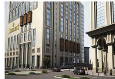
فندق ماريوت أحد المشروعات الجديدة بمنطقة جبل عمر التي سيتم افتتاحها خلال عام ١٤٣٧ / ١٤٣٦ هـ.

- فندق ماريوت أحد المشروعات الجديدة بمنطقة جبل عمر التي سيتم افتتاحها خلال عام ١٤٣٧ / ١٤٣٦ هـ.