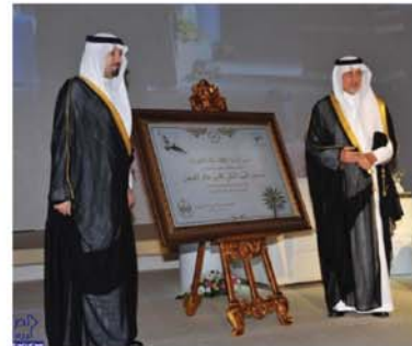
صاحب السمو الملكي الأمير مشعل بن عبد الله بن عبد العزيز أمير منطقة مكة المكرمة يعان من منح جائزة مكة لتميز بكافة فروعها التنموية في دورتها السادسة لعام ١٤٣٥هـ لصاحب السمو الملكي الأمير خالد الفيصل وزير التربية والتعليم وذلك يوم الأحد ١٥/٧/١٤٣٥هـ.

١ - المساهمة في دعم ورعاية حفل جائزة مكة لتميز في دورتها السادسة خلال شهر رمضان ١٤٣٥هـ بمبلغ ٦٦٦,٦٦٦ ريال (ستمائة ستة وستون ألف وستمائة ستة وستون ريال).