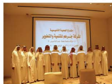
اجتماع الجمعية التأسيسية لشركة جرمه للتنمية والتطوير والذي عقد يوم الخميس ١٧ ربيع الأول ١٤٣٦ هـ.

إن هذا المشروع الحيوي الهام تساهم فيه شركة مكة للإنشاء والتعمير بحصة نقدية قدرها ١٦,٤٨٪ بمبلغ ٢٨,٨٤٦,١٥٠ ريال) من رأس مالها البالغ ١٧٥ مليون ريال وهذه المساهمة أعلنت عنها الشركة في موقع تداول بتاريخ ١٤٣٥/٥/٤هـ وكذلك بالتقرير السنوي الخامس والعشرين لعام ١٤٣٥هـ، وسيتم الإعلان لاحقاً عن أي تطورات جديدة في هذا الشأن.