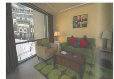
منازل من الفلل التي تم تشطيبها وفرشها بالمراد العلني بمنطقة جبل عمر خلال عام ١٤٣٥ / ١٤٣٤ هـ.

- كما تم الانتهاء بشكل كامل من تشطيب وفرش عدد (٢٢) فيلا وعدد (١) بنتهاوس على سطح البرجين H8 و H9 وتظل مباشرة على الكعبة المشرفة (ضمن المرحلة الثانية) وسيتم بيعها بالمراد العلني خلال شهر جمادى الأولى لعام ١٤٣٦هـ، ومتوقع مשיئة الله تعالى تحقيق مبالغ من بيعها أكثر من الدراسات المالية ودراسات الجدوى المعدة مسبقاً كما حدث مع الفلل التي تم بيعها في وقت سابق.