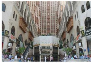
المركز التجاري والمشروع الأول لشركة مكة للإنشاء والتعمير.

تم تخصيص مساحات بالمركز التجاري والمصلى بدون قيمة إيجارية (الإلقاء الدروس والمحاضرات الدينية والبرامج الدعوية وتحفيظ القرآن الكريم وتعليم اللغة العربية والتوجيه والإرشاد وتوزيع المصاحف