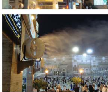
التبريد الضبابي بساحات الحرم المكي الشريف