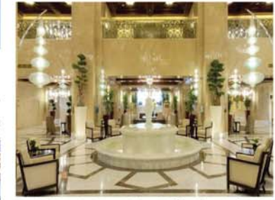
فندق مكة هيلتون للأجنحة أحد المشروعات التي تم افتتاحها بمنطقة جبل عمر عام ١٤٣٥ / ١٤٣٤ هـ.

- وحيث أن المشروع هو الأكبر في المنطقة المركزية بمكة المكرمة ويوم المساهم بشركة مكة الوقوف على كل ما هو جديد في هذا المشروع الحيوي الهام.