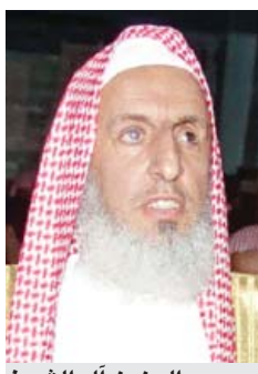
عبد العزيز آل الشيخ

جاء ذلك في إجابة لسماحة أمس خلال برنامجه الأسبوعي (بنايعة الفتوى) الذي تبثه إذاعة نداء الإسلام من مكة المكرمة ويعدده ويقدمه الشيخ يزيد البريش. وأوضح مفتي عام المملكة بأن سؤال الله ودعائه أمر مطلوب وعبادة لله جل وعلا قال له تعالى (وقال ربكم ادعوني استجب لكم إن الذين يستكبرون عن عبادتي - أي عن دعائي - سيدخلون جهنم داخرين)، وقال جل من قائل (وإذا سالك عبادي عني فإني قريب أجيب دعوة الداع إذا دعان)، وقال عن عباده المؤمنين أصحاب رسول الله صلى الله عليه وسلم (وما كان قولهم إلا إن قالوا ربنا انظر لنا ذنوبنا وإنسرفنا في