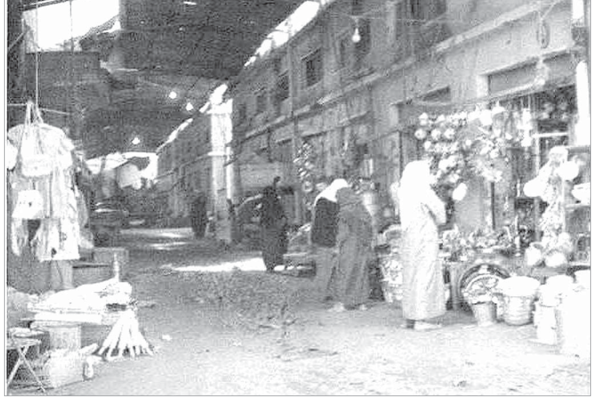
سوق مسقوف.. (قيصرية)

هذه المواد نشرت بتاريخ 7 - 4 - 1380 الخميس 9 / 9 / 1960