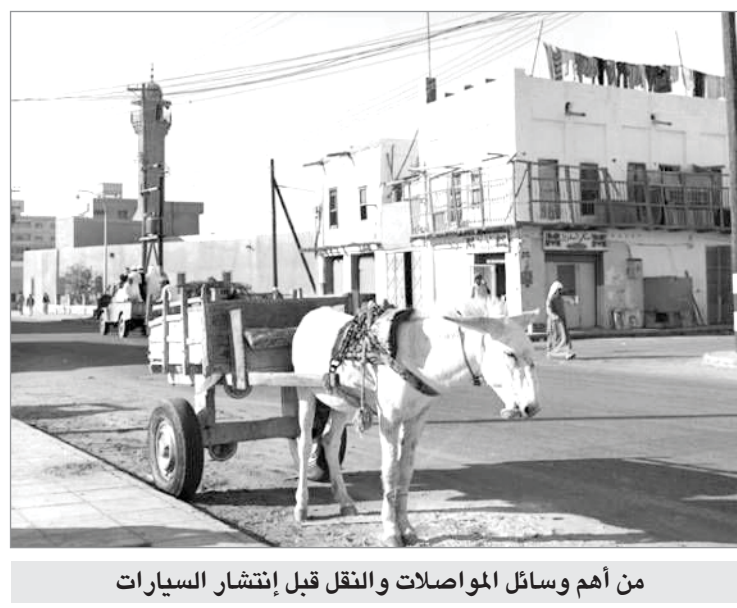
من أهم وسائل المواصلات والنقل قبل إنتشار السيارات