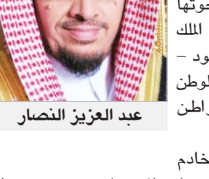
عبد العزيز النصار

شكّن معالي رئيس ديوان المظالم رئيس مجلس القضاء الإداري الشيخ عبد العزيز بن محمد التمام الضامين السامية والروى الطموحة التي حوتها كلمة خادم الحرمين الشريفين الملك سلمان بن عبدالعزيز آل سعود -أيده الله-، مساء -حفظه الله-، وحشد فيها معالم عهده الزاهر بما رسّله العمل على الأسمى الثابتة التي قامت عليها هذه البلاد المباركة منذ نشأتها على يد الملك عبدالعزيز آل سعود -رحمته الله-، وبوسع تحقيق التنمية الشاملة في كل أرجاء المواطن، مشيراً إلى أنها تعبر عن شخصية الملك المفدى الحكيم الذي يتابع شؤون بلاده وشعبه في كل الظروف والتغيرات ويهتم بأقن التفاصيل الجميلة بهما . وبيّن سموه أن كلمة خادم الحرمين الشريفين الملك سلمان بن عبدالعزيز، أوجت القرب والسعدت القلوب لما حملت من الدلالات والقيم التي أكدت حرصه المعتاد على رفاهية المواطن، وحفظ أمنها، وتحقيق التنمية الشاملة في كل المجالات، وفي كل أرجاء المواطن، مشيراً إلى أنها تعبر عن شخصية الملك المفدى الحكيم الذي يتابع شؤون بلاده وشعبه في كل الظروف والتغيرات ويهتم بأقن التفاصيل الجميلة بهما .