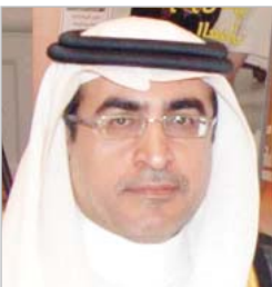
د. عزام الدخيل

الزيد من الجهد في التحصيل العلمي، فقد تضمنت الكلمة الضافية رسالة من خادم الحرمين الشريفين لأبناءه الطلبة القيمة تمثل نبراساً لهم في مسيرتهم التعليمية. وأضحت إياهم أمام مسؤولية الإسهام في بناء هذا الوطن بقوله -أيده الله- " إن هذا الوطن ينتظر منك الكثير، فليكن من تحروص على استغلال أوقاكتك في التحصيل . وأشار إلى أن هذا القطاع يسير وفق تطورات القيادة النهوض به، من خلال التكامل بين شقي التعليم العالي والعام، وربط الفرجات مع حاجة سوق العمل والتنمية وهو ما تعمل عليه الوزارة. واختتم معالي وزير التعليم تصريحه، برفع أسس آيات الشكر والعرافان لخادم الحرمين الشريفين، ولسمو ولي عهده الأمين، ولسمو ولي ولي العهد، حفظهم الله، على ما يولونه لقطاع التعليم من رعاية كريمة ودعم سخّي.