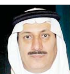
نايف بن ثنيان

نوه سمو الأمير الدكتور نايف بن ثنيان بن محمد رئيس قسم الإعلام في جامعة الملك سعود، بضامين الكلمة السامية التي وجهها خادم الحرمين الشريفين الملك سلمان بن عبدالعزيز آل سعود -حفظه الله- للمواطنين، وهي في كل أرجاء المواطن، مشيراً إلى أنها تعبر عن شخصية الملك المفدى الحكيم الذي يتابع شؤون بلاده وشعبه في كل الظروف والتغيرات ويهتم بأقن التفاصيل الجميلة بهما . وبيّن سموه أن كلمة خادم الحرمين الشريفين الملك سلمان بن عبدالعزيز، أوجت القرب والسعدت القلوب لما حملت من الدلالات والقيم التي أكدت حرصه المعتاد على رفاهية المواطن، وحفظ أمنها، وتحقيق التنمية الشاملة في كل المجالات، وفي كل أرجاء المواطن، مشيراً إلى أنها تعبر عن شخصية الملك المفدى الحكيم الذي يتابع شؤون بلاده وشعبه في كل الظروف والتغيرات ويهتم بأقن التفاصيل الجميلة بهما . وبيّن سموه أن كلمة خادم الحرمين الشريفين الملك سلمان بن عبدالعزيز، أوجت القرب والسعدت القلوب لما حملت من الدلالات والقيم التي أكدت حرصه المعتاد على رفاهية المواطن، وحفظ أمنها، وتحقيق التنمية الشاملة في كل المجالات، وفي كل أرجاء المواطن، مشيراً إلى أنها تعبر عن شخصية الملك المفدى الحكيم الذي يتابع شؤون بلاده وشعبه في كل الظروف والتغيرات ويهتم بأقن التفاصيل الجميلة بهما .