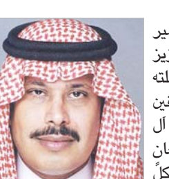
مشاري بن مسعود

نوه صاحب السمو الملكي الأمير مشاري بن عبد العزيز بن مساعد أمير منطقة الباحة، بما حملته كلمة خادم الحرمين الشريفين الملك سلمان بن عبدالعزيز آل سعود -حفظه الله-، من معان سامية ضافية لا تحصى على مضامينها وأصنافها، وما يحق لتطلعاتها، وبإيادها والحمد تشيد وتطوراً مستمراً، تشهد في نهضة شاملة في شتى مناحي الحياة، وما ذلك إلا لبلاء على ما تتميز قيادتنا الرشيدة لكل ما فيه صالح الوطن والمواطن وتكاتف حرص حكومة خادم الحرمين الشريفين على تحقيق تطلعاتها".