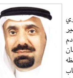
جلوي بن مسعود

قال صاحب السمو الأمير جلوي بن عبد العزيز بن مساعد أمير منطقة نجران: " إن كلمة خادم الحرمين الشريفين الملك سلمان بن عبدالعزيز آل سعود -حفظه الله- التي وجهها لأصحاب السمو الملكي الأمراء والسماة والمسؤولين في كافة نواحي المملكة، وبإيادها والحمد تشيد وتطوراً مستمراً، تشهد في نهضة شاملة في شتى مناحي الحياة، وما ذلك إلا لبلاء على ما تتميز قيادتنا الرشيدة لكل ما فيه صالح الوطن والمواطن وتكاتف حرص حكومة خادم الحرمين الشريفين على تحقيق تطلعاتها".