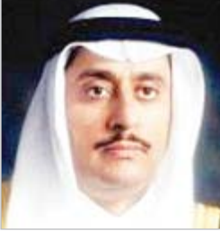
د. عزام الدخيل

وصف معالي نائب وزير التعليم العالي الدكتور أحمد بن محمد السيف، الكلمة التي وجهها خادم الحرمين الشريفين الملك سلمان بن عبدالعزيز آل سعود -حفظه الله-، لمس المواطنين والوطناء، بالضامين والقيّم التي تشتمل على كل ما يدعو إلى التنافس في كل الشؤون التي تمهيداً للملكة، وقال " إن كلمة خادم الحرمين الشريفين -حفظه الله- ضافية وتنازلت جميع الشؤون الاجتماعية والأمنية والسياسية والاقتصادية والعمرانية، بما يحق لتطلعات المواطن والوطنية في التنمية الشاملة والتنمية والتوازن في كافة النطاق، وبما يضمن الاستقرار للمملكة ومواصلتها البناء في كل الميادين " مبيناً أن خادم الحرمين الشريفين -حفظه الله- أكد على وجوب تحقيق كل ما من شأنه أن يضمن تحقيق التفاعل لدى مشرق أبنائه وولائه المواطنين والوطناء وقال الدكتور السيف: لا شك أن كلمة خادم الحرمين الشريفين حملت رؤية حكيمة بأن تنسج الخطى ثابتة وخطة نمو التنوير، وهي جوانب غاية الأهمية، وأن، -حفظه الله- أكد على العمل على توفير سبل الحياة الكريمة لفئات المجتمع بأكمله، ووجه بشيخركم كل الامكانيات التي تخدم الوطن والمواطن وتوفر أسباب الرخاء لهم .