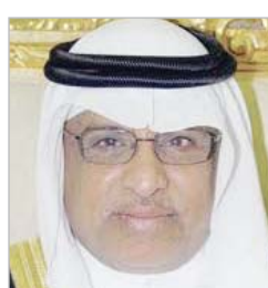
د. بكر عيسى

نوه معالي مدير جامعة أم القرى الدكتور بكر بن معنوق عباس بالكلمة الضافية التي وجهها خادم الحرمين الشريفين الملك سلمان بن عبدالعزيز آل سعود -حفظه الله- لإخوانه وأبنائه في هذه البلاد المباركة، مؤكداً أن كلمته -حفظه الله- من مخرجاته على دستور البلاد الكتاب والسنة موضحة في الوقت نفسه للأخذ بكل ما من شأنه وحدة الصف وجمع الكلمة والدفاع عن قضايا الأمة على هدي من تعاليم جميع الكلمة والدفاع عن ارتقاء الأمة ورفاهيتها، وهو دين السلام والرحمة والوسطية والاعتدال وكرامات وآدابها وتوجيه مدى ما يحمله -حضره الله- في فكره من أسس إيجابية وروى وتطلعات لتحقيق الأمن والاستقرار في العالين العربي والإسلامي، ونصرة قضاهم وتوفير الرفاهية والرخاء والازدهار والوطن والمواطن وتحقيق العمل المشترك على تراب هذه البلاد المباركة التي قامت وتقوم على كتاب الله الحكيم وسنة رسوله صلى الله عليه وسلم. وأبان معاليه أن الكلمة حملت مضامين إنسانية وتعليمية وإيضاحية على مضامين اقتصادية تمس حياة كل مواطن سعودي حيث أكد - رحمه الله -