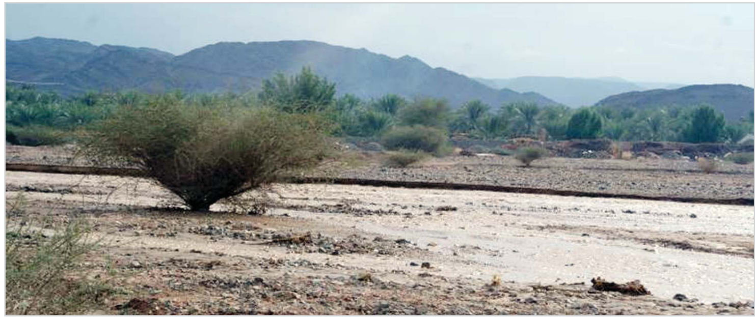
المدينة المنورة - جازي الشريف

الرحلات والاستمتاع بالسمرحول شبة النار والجلوس بجوارها والمسامرة بالحديث والتسليّة، ويعكس ذلك على المحلات الخاصة ببيع لوازم الرحلات البرية وزيادة حركة مبيعاتها خلال هذه الفترة. كما تكثف أمانة منطقة المدينة التعريف بمنتزه البيضاء البري للمتزهين من هواة الاستمتاع بالبر والتخييم والأجواء الطبيعية الخلابة وخلق الانسجام النفسي بالابتعاد عن أجواء المدينة حيث تكون تلك المواقع الجميلة الملائم للحقيقي للمتزهين بغية قضاء أجمل الأوقات وسط أحضان وتضاريس الطبيعة. ويعد منتزه البيضاء منتزها طبيعيا يقع شمال غرب المدينة المنورة على مسافة ٢٠ كلم تقريبا، وأرضه رمليّة، تحيط بها الجبال من جميع الجهات، وتتمو به أشجار