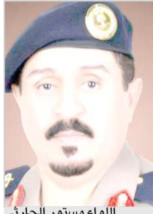
اللواء مستور الحارثي