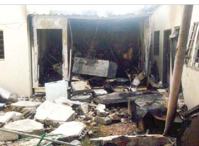
وفاة وإصابة ٦ وافدين في حريق استراحة