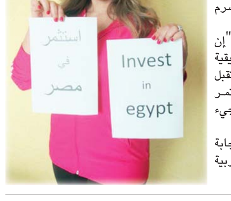
القاهرة - الوكالات: