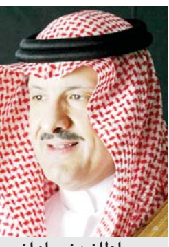
سلطان بن سلمان

وتتضمن سياسيات إقامة معارض السلع الاستهلاكية وفقاً للقرار الجديد، التي ستحل محل شروط وضوابط إقامة مهرجانات التسوق الصادرة بقرار معالي وزير التجارة والصناعة رقم (٦٢٠) وتاريخ ١٤٢٣/٦/٩هـ، عدداً من الاشتراطات منها: أن يكون المتقدم لتنفيذ المعرض