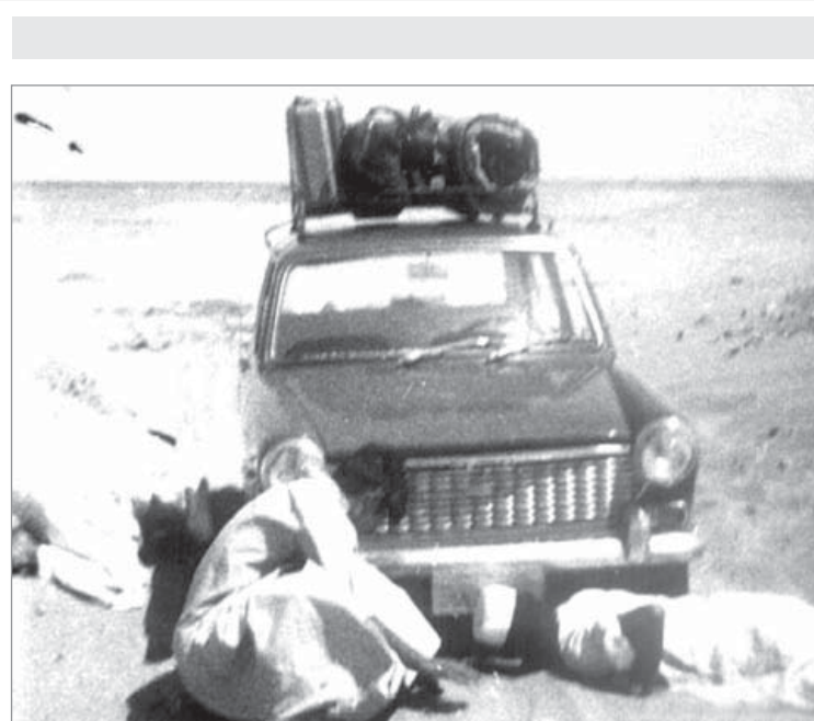
تعطلت سيارتهم وهم في الطريق لأداء العمرة ١٩٧٤م

تقوم فرقة كشفية من ابناء مدينة الخرج هذه الايام برحلة استطلاعية للتعرف على كافة مناطق المملكة حيث زارت معظم الدوائر والمصالح الحكومية في المناطق التي مرت بها وتعرفت على النواحي العمرانية والاجتماعية بها. هذا وقد قامت الفرقة بزيارة مكتب البلاد بمكة صباح يوم امس الاول ضمن نطاق جولتها في العاصمة المقدسة.