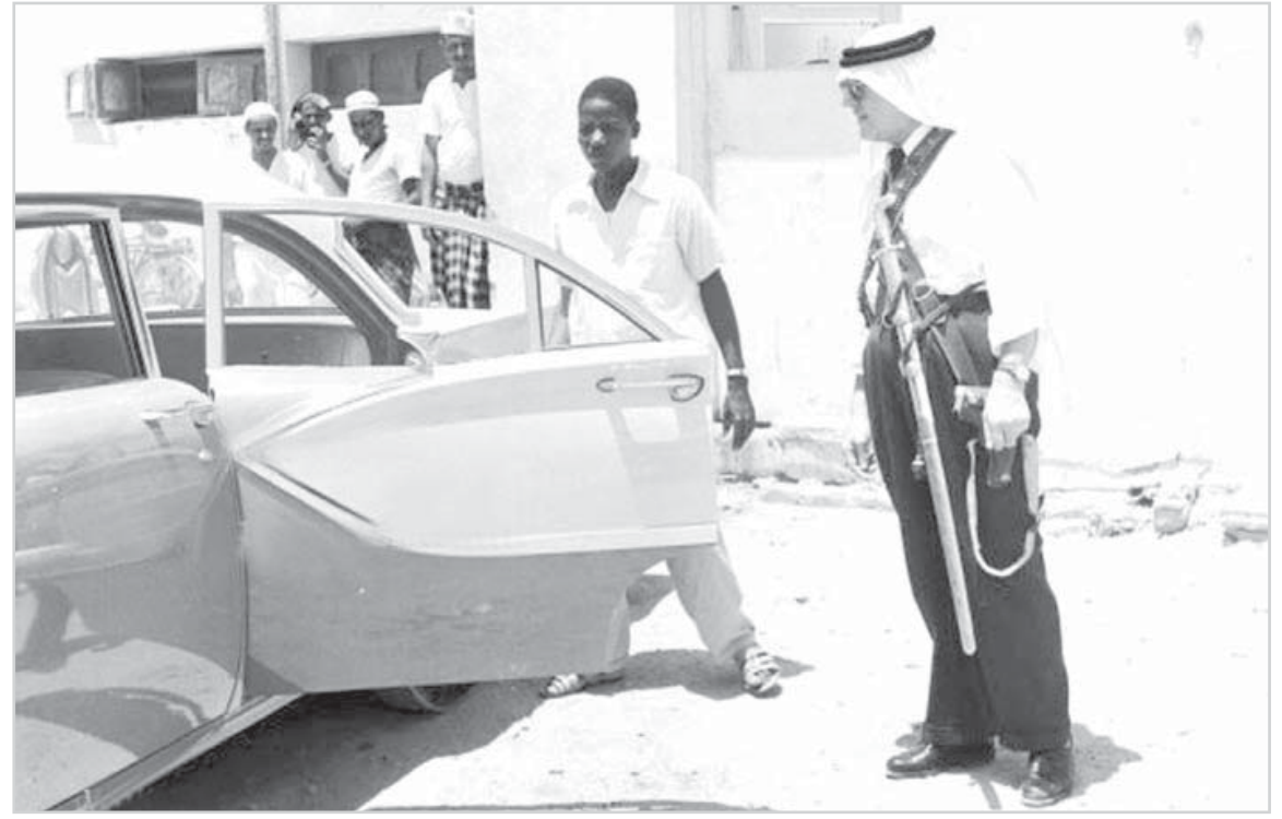
طباخ الملك سعود متقلداً سيفاً أهده له الملك سعود

هذه المواد نشرت بتاريخ 15 - 3 - 1384 هـ - 17 / 7 / 1964م