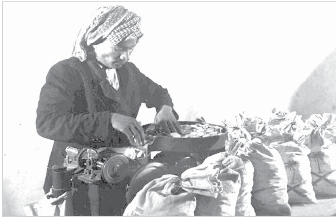
محاسب يحيى النقود المعدنية استعداداً لتوزيع رواتب الموظفين بالظهران - اواخر الاربعينات