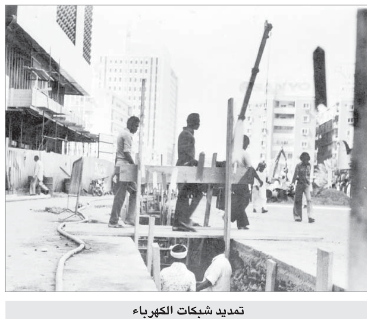
تمديد شبكات الكهرباء