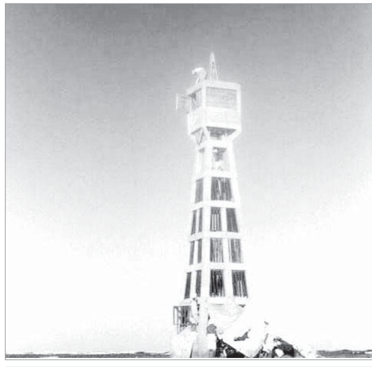
بيت (مسماوي) والمعروف ببيت الضوء البحري الذي يرشد السفن- جدة ١٩٤٥م