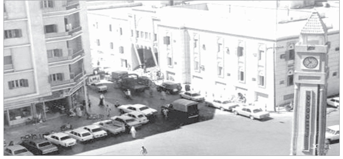
الديرة والساعة المشهورة...

هذه المواد نشرت بتاريخ 10 - 4 - 1380 الأحد 1960/10/2