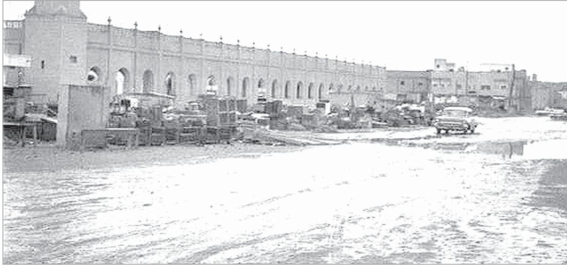
الديرة .. والجامع الكبير .. قبل هدمه وإعادة بنائه...