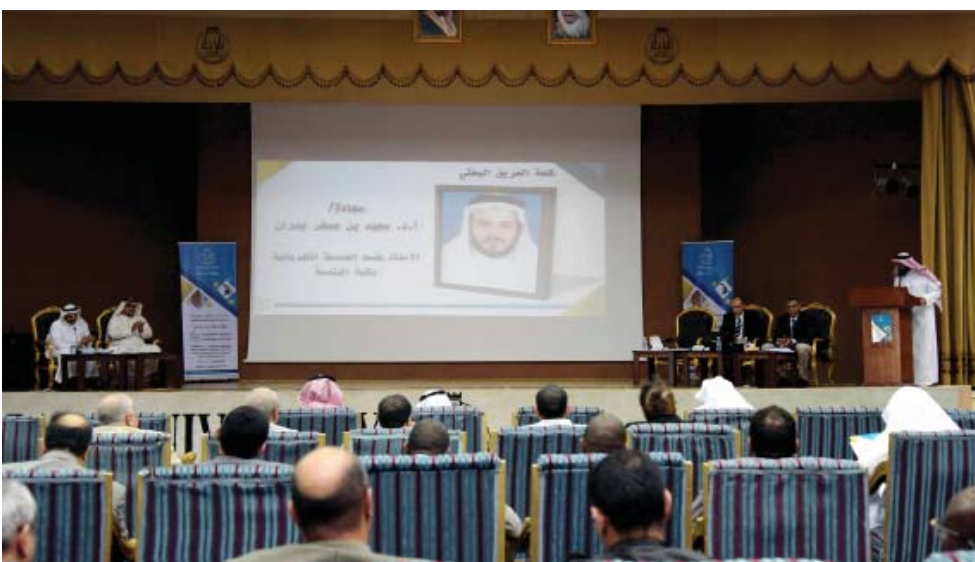
المؤتمر الدولي لرأس المال الفكري بجامعة الباحة

جدة - غفران إبراهيم شهدت جدة ختام دورة «خطّة الأعمال» والتي أقيمت باعتماد المؤسسة العامة للتدريب التقني والمهني وبالتأكيد على أن خطط الأعمال تزيد من معدلات نجاح الأعمال التجارية ومشاريع ريادة الأعمال.