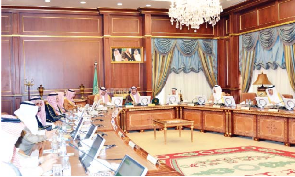
المدينة المنورة - جازي الشريف

ترأس صاحب السمو الملكي الأمير فيصل بن سلمان بن عبدالعزيز، أمير منطقة المدينة المنورة اجتماع الجلسة الأولى من الدورة الأولى لمجلس منطقة المدينة المنورة. حيث استهل سموه الكريم الاجتماع بالتأكيد على أن الميزانيات التي اعتمدها للجهات الخدمية في المنطقة تتطلب المزيد من المثابرة والعمل المستمر لترجمتها على أرض الواقع بحيث يلمس المستفيدون جدواها سيما وأن خادم الحرمين الشريفين الملك سلمان بن عبدالعزيز "حفظه الله" يؤكد دوماً على ضرورة الحرص على المضي قدماً في مسيرة التنمية وتنفيذ المشروعات وفق الجداول الزمنية المتعددة لها بما يحقق تطلعات المواطنين والمواطنات لكونهم الشغل لتمامه الكريم. كما أكد سمو أمير منطقة المدينة المنورة على ضرورة المتابعة المستمرة لمستوى الخدمات المقدمة للمستفيدين لنيل رضاهم وأن البرامج والخطط لا بد وأن تحقق الأهداف التي تسعى إلى تحقيقها القيادة الرشيدة. ثم انتقل المجلس لمناقشة جدول الأعمال الذي تضمن استعراضاً للميزانيات المتعددة والبرامج الجديدة للجهات الحكومية.