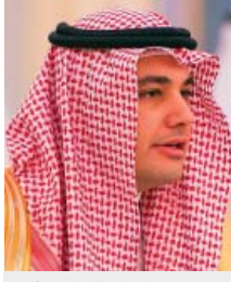
د. عادل الطريفي

الرياض - واس رفع معالي الدكتور عادل بن زيد الطريفي شكره وتقديره لخادم الحرمين الشريفين الملك سلمان بن عبدالعزيز آل سعود - حفظه الله - على الثقة العالية بتعيينه وزيراً للثقافة والإعلام. وقال معاليه // إنها ثقة عالية أعزّت وأفخر بها، سائلاً الله سبحانه وتعالى أن يعينني على حمل الأمانة وأن أكون عند حسن ظن ولاة الأمر - رعاهم الله - //