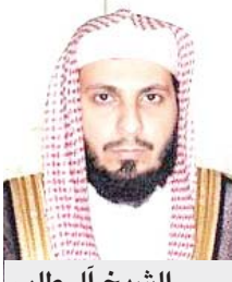
الشيخ آل طالب

مكة المكرمة - البلاد ثمن فضيلة إمام خطيب المسجد الحرام ورئيس مجلس إدارة جمعية هدية الحاج والمعتمر الخيرية الشيخ صالح بن محمد آل طالب الأوامر الملكية التي أمر بها خادم الحرمين الشريفين الملك سلمان بن عبدالعزيز آل سعود - حفظه الله - وأكد آل طالب أن هذه القرارات التاريخية جاءت استجابة لتطلعات الشعب السعودي الكريم، وأدخلت السرور على قلب كل مواطن وموطنة بما اشتملت عليه من أوامر معبرة عن الروح الواحدة التي تربط القيادة بالشعب والساعة لتحقيق طموحاته.