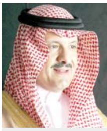
سلطان بن سلمان

الرياض - واس رضى صاحب السمو الملكي الأمير سلطان بن سلمان بن عبد العزيز رئيس الهيئة العامة للسياحة والآثار أمس حفل توقيع عقد تأسيس الشركة السعودية للضيافة التراثية التي أعلنت عنها الهيئة مؤخرًا، بحضور صاحب السمو الأمير خالد بن سعود بن خالد وكيل وزارة الخارجية، وصاحب السمو الأمير أحمد بن عبدالله بن عبد الرحمن محافظ الرياض، والوزير الدكتور توفيق الربيعي، ومعاالي وزير الشؤون البلدية والقروية المهندس عبداللطيف آل الشيخ، ومعاالي أمين منطقة الرياض المهندس إبراهيم السلطان ومعاالي أمين منطقة المدينة المنورة الدكتور خالد طاهر، ومعاالي المهندس هاني أبو راس أمين جدة، وأمين الاحساء المهندس عادل اللحوم، وذلك في التحف الوطني بالرياض.