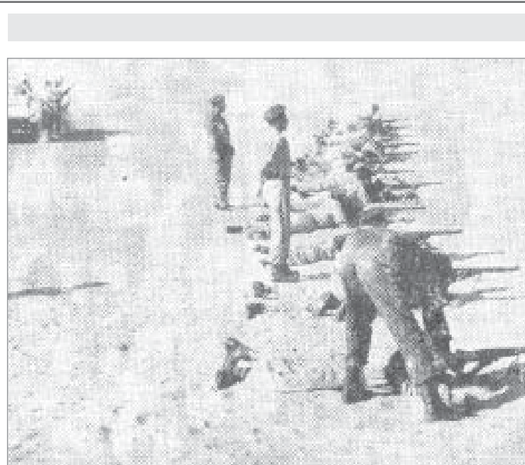
جانب آخر من المتطوعين أثناء تدريباتهم على الرماية بالذخيرة الحية

كان مفتش عام الاسواق ببلدية جدة السيد عبداللّه ناس قد قام بضبط حوالي سبعة آلاف من المعلبات الفاسدة المعروضة للبيع والاواني التي تستعمل في المطاعم والمقاهي وهي الخطوة الطيبة من جانب البلدية دليلا على عنايتها واهتمامها. والصورتان المنشورتان هنا يمثلان المعلبات والاواني التي تم اتلافها ونحن اذ ننشرهما للبلدية ورئيسها المنتدب ومفتشها ما يقومون به من جهد في سبيل الصالح العام.