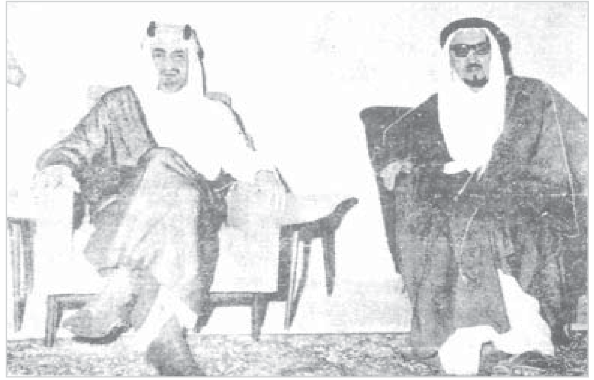
سمو الأمير فيصل مع أحد أعيان المنطقة الشرقية

هذه المواد نشرت بتاريخ 07 - 01 - 1384هـ 13 / 3 / 1963م