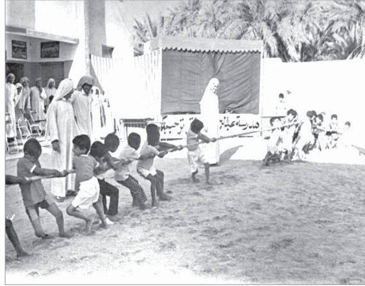
نشاط رياضي في إحدى المدارس