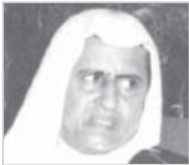
الأمير مساعد بن عبدالرحمن