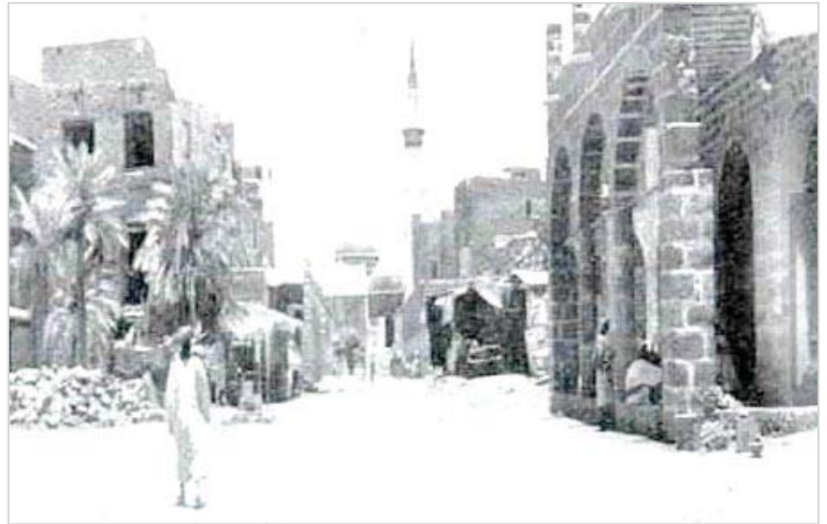
من المدينة المنورة

هذه المواد نشرت بتاريخ 29-2-1384هـ - 10/7/1964م