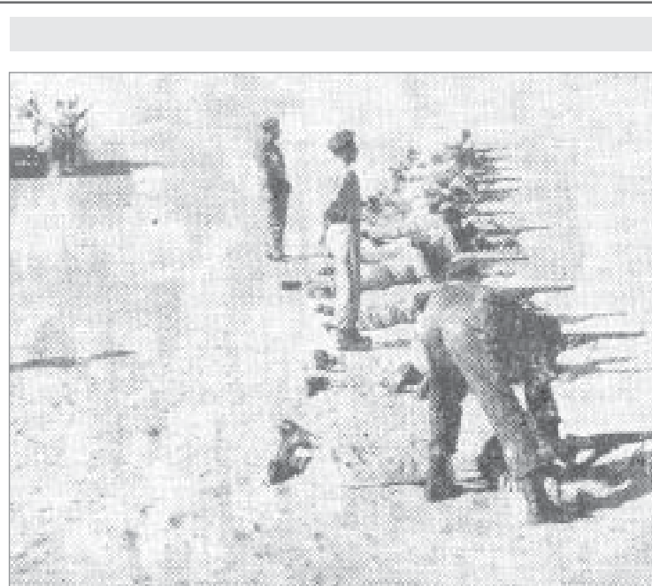
جانب آخر من المتوطنين أثناء تدريباتهم على الرماية بالذخيرة الحية