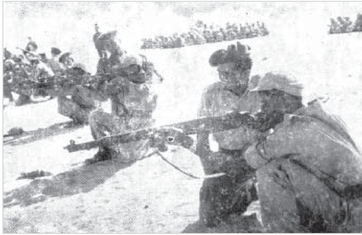
سجلت عدسة (البلاد) هذه الصورة للمتوطنين أثناء تدريباتهم على الرماية بالذخيرة الحية