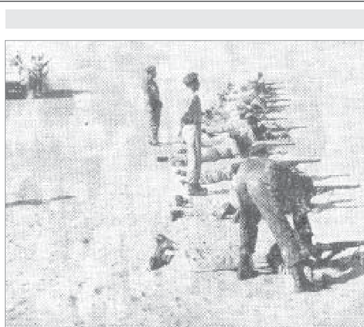
جانب آخر من المتطوعين أثناء تدريبهم على الرماية بالذخيرة الحية

وذلك في تمام الساعة العاشرة من ايام اقامة البطولات.